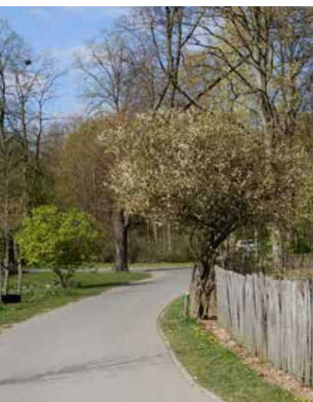
De Bomen uit Verre Streken-wandeling loopt langs dit citroenboompje

Wil je met een groep van maximum 24 deelnemers komen wandelen onder begeleiding van een gids? Dat kan, na het maken van een reservering. Meer info: https://www.provincieantwerpen.be/aanbod/dvt/rivierenhof/aanbod-voor-groepen/wandelingen-op-aanvraag.html