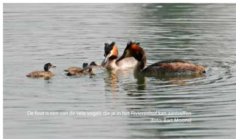
De fuut is een van de vele vogels die je in het Rivierenhof kan aantreffen