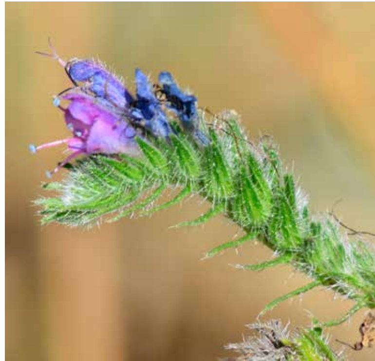
Slangenkruid, bloem bovenaan met uitstekende gesplitste stijl

Al die bezoekende insecten zorgen voor de bestuiving, hoe sterk zij ook in grootte verschillen. In de bloemen staat het nauwste deel van de bloemkroon, dat de nectar bevat, schuin