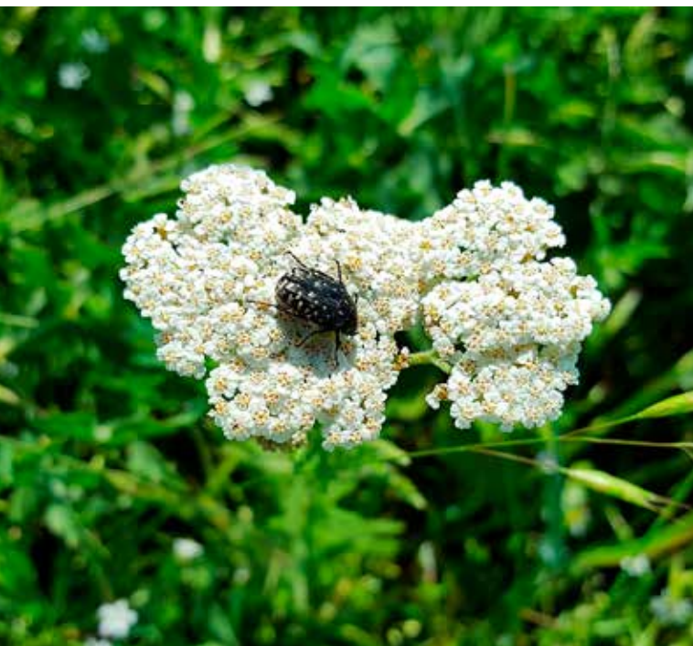
Duizendblad met rouwende gouden tor

In het vorige nummer van Natuur.stad gaven we enkele tips om je tuin klimaatbestendig te maken op vlak van water. Tuinen vormen namelijk een groot potentieel in de strijd tegen klimaatverandering. In dit tweede en laatste deel focussen we op de overige tips om je tuin klimaatproof te maken.