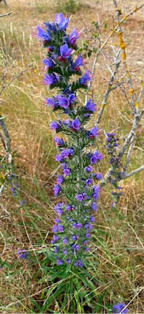
Slangenkruid in bloei

De meeldraden steken ver uit de afstaande kroonbuis. De helmknopjes, die opspringen als de bloem opengaat, keren hun met stuifmeel bedekte zijde naar boven. Elk insect dat er zich neerzet, krijgt een pakje stuifmeel aan zijn pootjes of onderzijde. De stijl van die bloem groeit pas later uit en steekt dan nog verder uit dan de meeldraden. Wanneer insecten daar aanvliegen, beladen met stuifmeel van jongere bloemen, zorgen ze voor kruisbestuiving. En die voortplanting is van levensbelang.