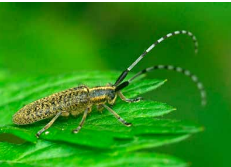
Gewone distelboktor

Ze zijn geliefd bij verzamelaars omwille van de lange antennes aan hun kop (die doen denken aan de gekromde hoorns van bokken) en omdat ze vaak groot en/of mooi gekleurd zijn. Door anderen worden deze kevers dan vaak weer verfoeid omwille van de schade die sommige soorten aanbrengen aan hout.