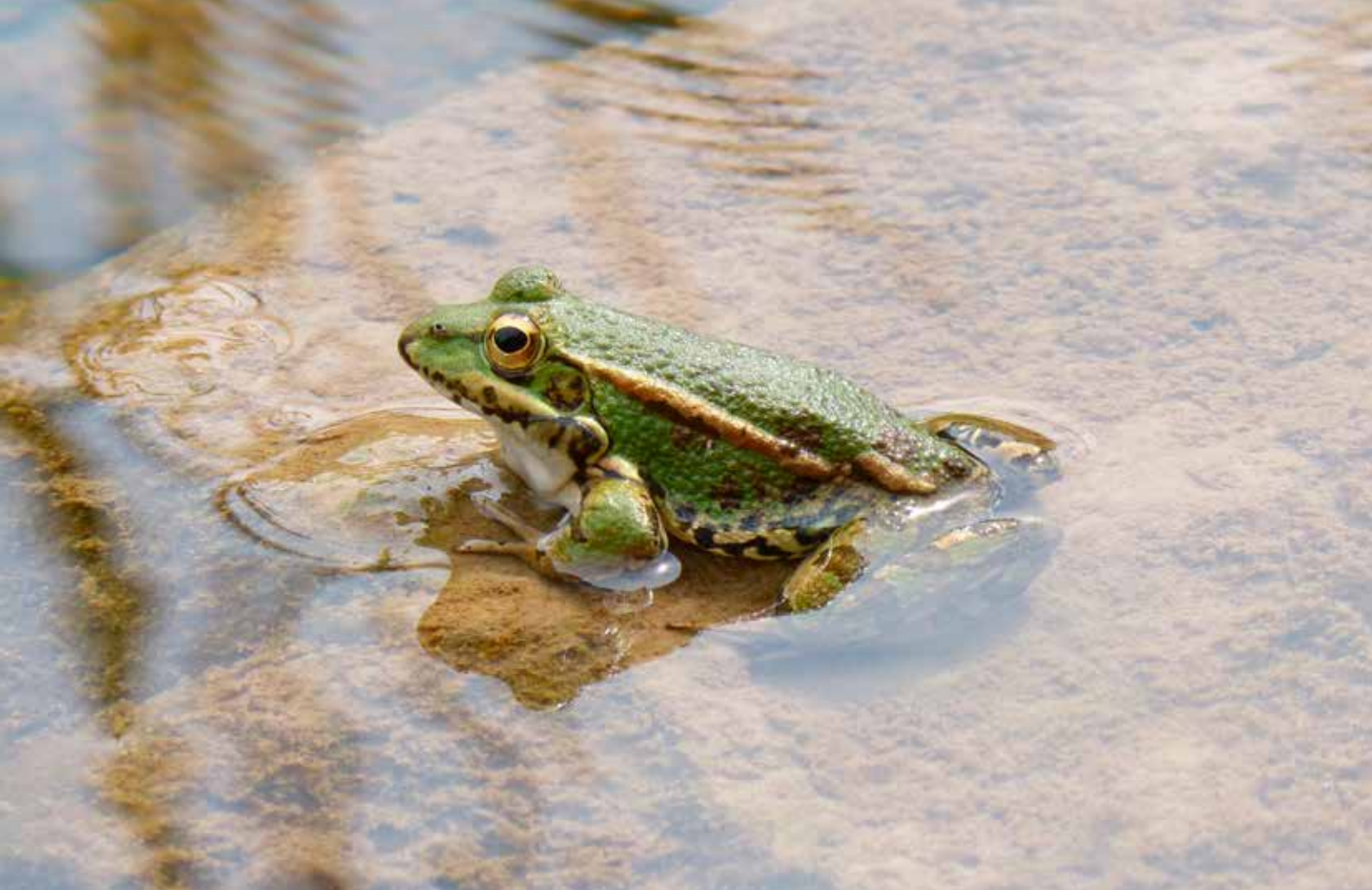
Stenen aan de rand van de vijver helpen dieren

De insecten kunnen je hulp ook gebruiken, het gaat namelijk niet goed met heel wat vlinders, bijen en kevers. Plant daarom waardplanten, dit zijn planten die organismen nodig hebben om te groeien en te ontwikkelen. Een goede waardplant is de brandnetel, waarop heel wat vlinders hun eitjes leggen en waar de rupsen van eten. Plant ook planten die veel nectar produceren (bv. duizendblad) en laat dood hout en bladeren liggen.