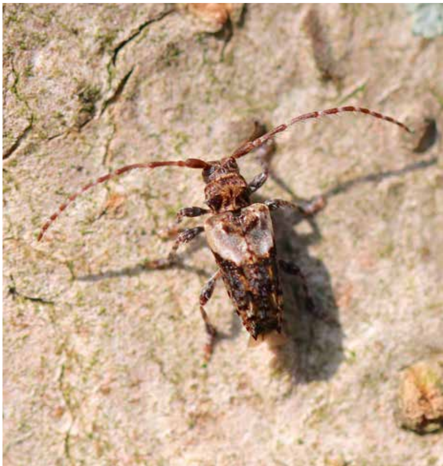
Gewone borstelboktor

De kleine wespenboktor is een fascinerende soort die zowel in zijn gedrag als uiterlijk een wesp nabootst. Dat is efficiënt om aanvallers zoals insectenetende vogels af te schrikken. Van mei tot juli is de kever te vinden op stammen en twijgen en regelmatig ook op bloemen. De larven leven in verschillende loofhoutsoorten en soms in houten paaltjes. In Antwerpen