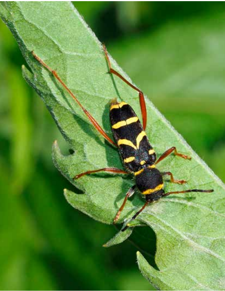
Kleine wespenbok

Stad op verschillende locaties gevonden, maar het vaakst in Wolvenberg.