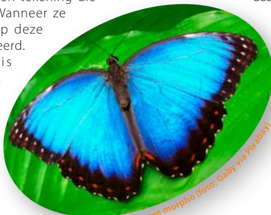
Blauwe morpho

Zoals vele vlinders heeft de blauwe morpho prachtige vleugels. De onderkant is bruin en heeft een tekening die lijkt op een oog. Wanneer ze stilzitten zijn ze op deze manier gecamoufleerd. De bovenkant is schitterend blauw. Die gebruiken ze om vogels te verblinden tijdens een achtervolging.