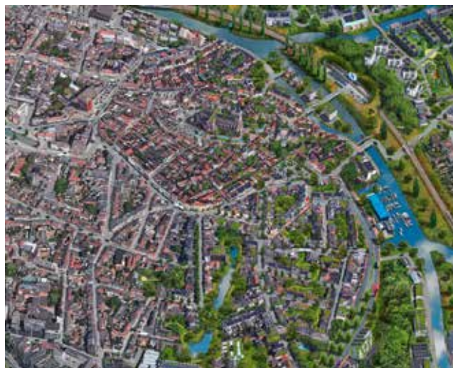
Detail uit het toekomstbeeld steden en dorpen met links de toestand die we kennen en rechts hoe een natuurinclusieve stad eruit kan zien (grafiek: Natuurpunt vzw)

Eén aspect bij uitstek beperkt de mogelijkheden: mobiliteit. De auto als hoeksteen van mobiliteit, zeker in de historische stad, is een absurde (en dodelijke) erfenis uit de vorige eeuw. Terwijl vroeger het Antwerpse buitengebied grappend 'de parking' werd genoemd, geldt die benaming nu voor de stad zelf. Geen enkele nederzettingvorm biedt meer winsten uit nabijheid en collectiviteit dan de stad – het was haar ontstaansreden. Als je die kwaliteit inzet voor mobiliteit kom je bij het model van de 15-minutenstad, waarin al je regelmatige behoeften op minder dan 15 minuten te voet, met de fiets of openbaar vervoer liggen, met de (deel)wagen als laatste vervoersoptie (het zgn. STOP-principe). Het levert ontzettend veel winst,