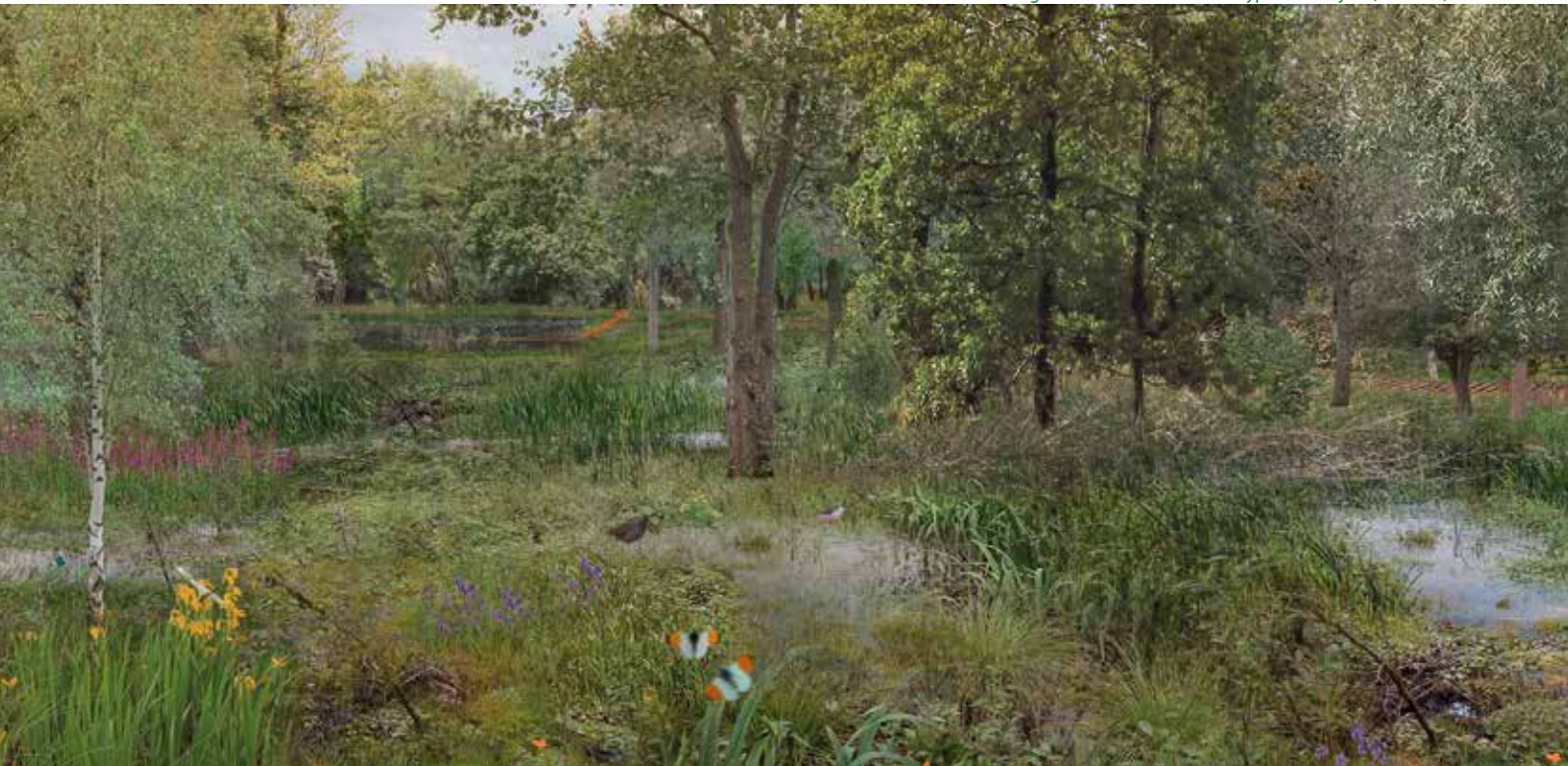
Wolvenberg: toestand centraal habitatype over 15 jaar

We hebben gepoogd om met dit nieuwe natuurbeheerplan een goede combinatie te bekomen tussen het recreatief gebruik door de mens en het ecologisch gebruik door de natuur. Een belangrijke functie van Wolvenberg-Brilschans schuilt ook in de educatieve waarde voor de talrijke Antwerpenaars die dicht bij hun woonplaats 'echte' natuur willen ontdekken. Ons reservaat zal daarom ook worden ingeschakeld in de natuureducatieve werking van het Natuurhuis Brialmont, dat in 2025 zijn deuren opent naast het natuureservaat. ■