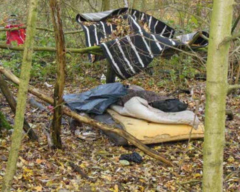
Geïmproviseerde tijdelijke slaappleaats van dakloze

vogels af die daar hun nesten bouwen. Hun jongen worden dan soms in de steek gelaten.