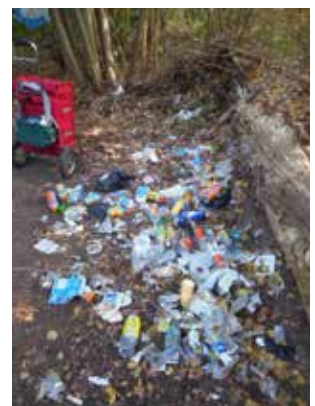
Resultaat van een “feestje” in de natuur

Om een kampje te maken moet je van de grotere paden afgaan: op zich is dat al nefast voor de planten en dieren, want er wordt veel platgetrapt. Maar ook het hout dat opgeraapt wordt bevat zwammen die in hun groei gestoord worden en kleine diertjes die hun schuilplaats nu kwijt zijn. De beweging en het rumoer waarmee zo'n kamp gebouwd wordt schrikt