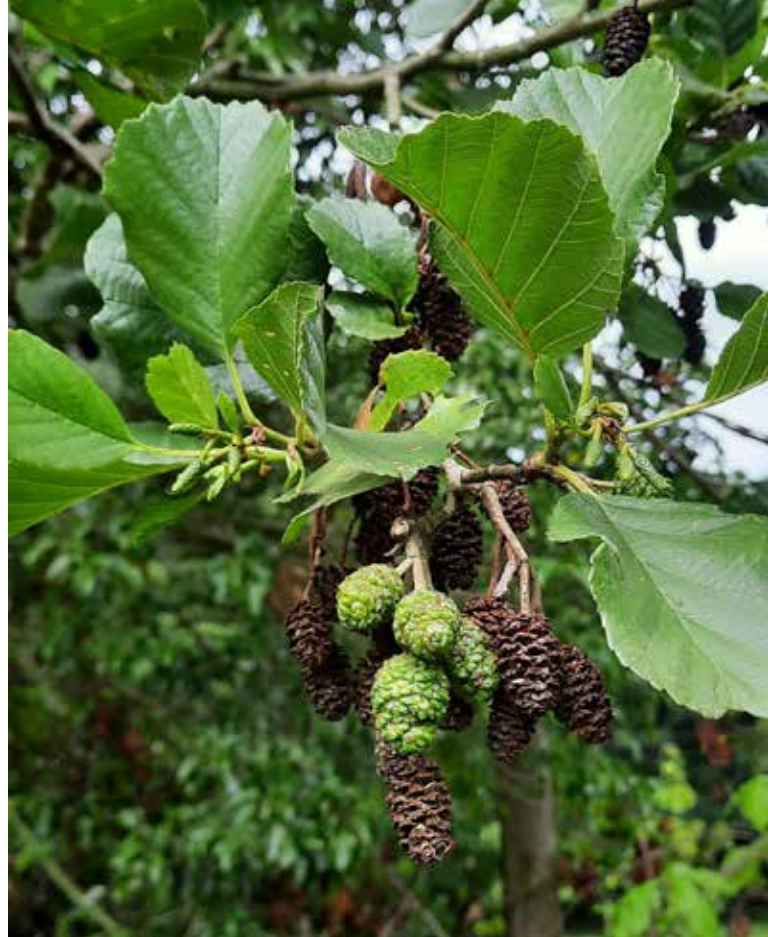
Zwarte els met kegeltjes en katjes

Elzen kunnen goed overleven in een zuurstofarme bodem, zoals na een overstroming. Dikwijls zijn ze aangeplant rond water en stabiliseren zo de rivieroeveren. Ze groeien ook goed op stikstofarme grond, door symbiose met de bacterie Frankia alni . Deze fixeert stikstof uit de lucht en huist in wortelknolletjes van de els. Ze maakt stikstof beschikbaar voor de plant, die haar in ruil suikers schenkt. De bodem wordt zo stikstofrijker, wat de groei van andere planten in de ondergroei van elzen stimuleert.