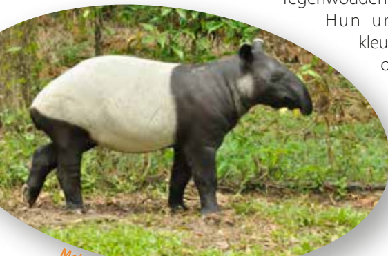
Maleise tapir

De Maleise tapir leeft in regenwouden en houdt van water. Hun unieke zwart-witte kleuren zouden ze hebben omdat ze zo minder opvallen wanneer het schemert. Hun jongen hebben eerder een bruine kleur met witte strepen en vlekken.