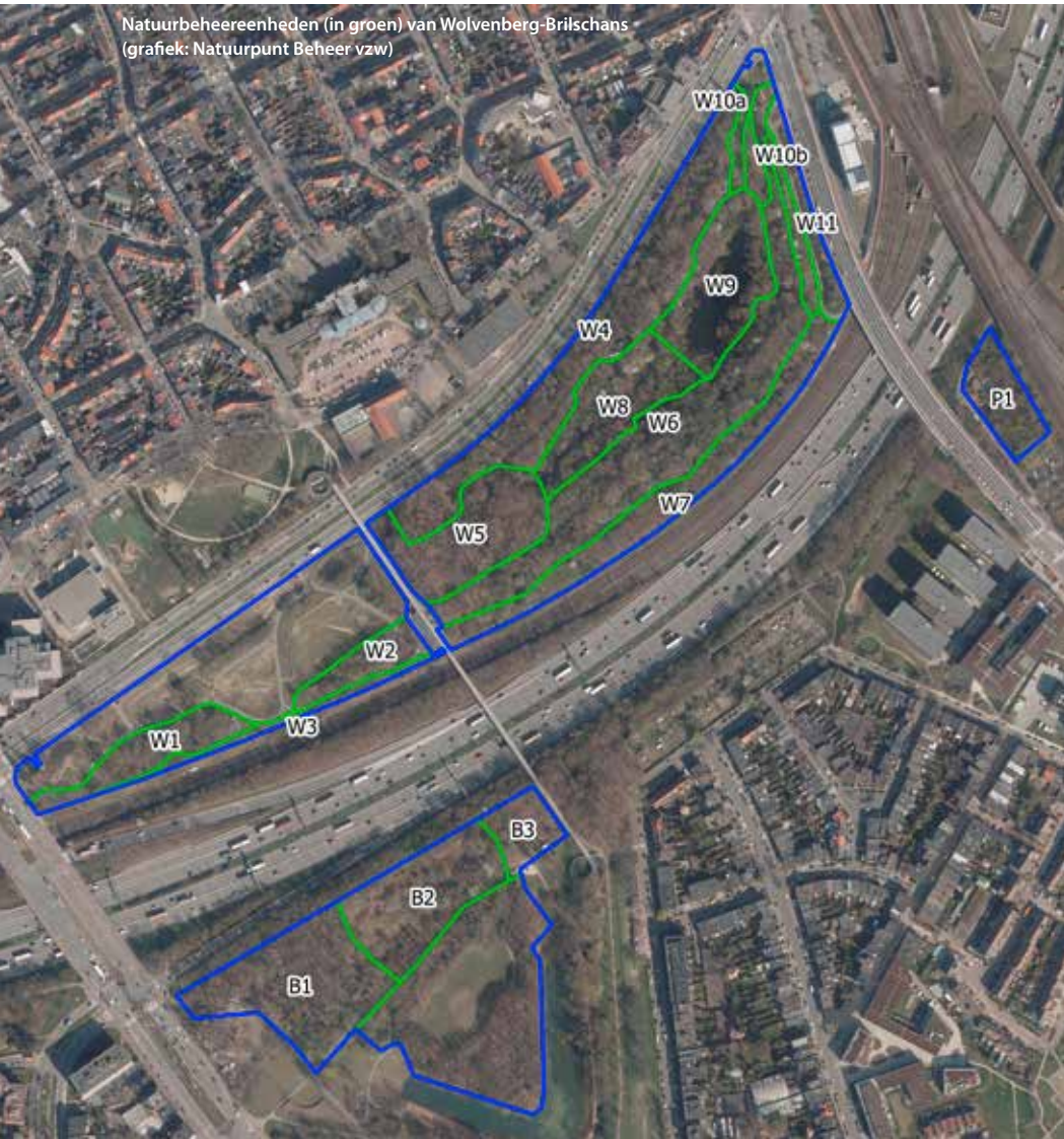
Natuurbeheereenheden (in groen) van Wolvenberg-Brilschans (grafiek: Natuurpunt Beheer vzw)

Op een aantal plaatsen zullen de huidige paden verdwijnen en verlegd worden. Zo zullen ze lokaal meer naar het midden van het gebied opschuiven waardoor ze dieper en achter een talud komen te liggen. Dit moet onder meer de geluidsbeleving verbeteren. Het lawaai van de ring is zowat het vaakst genoemde 'pijnpoint' bij bezoekers van ons natuurgebied.