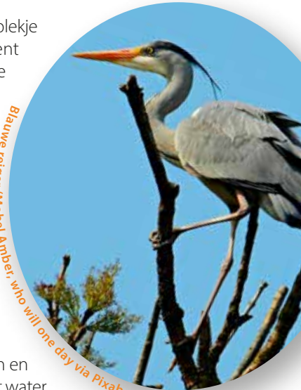
Blauwe reiger

Je kan ze vaak vinden bij de buitenverblijven van de zeehonden of zeeleeuwen, waar ze een visje proberen mee te pikken.