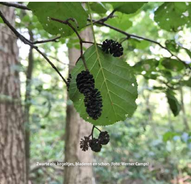
Zwarte els: kegeltjes, bladeren en schors

Afgehakt of afgezaagd elzenhout kleurt bij blootstelling aan de lucht oranje-rood. In de mythologie werd deze kleur geassocieerd met vitaliteit en mentale kracht. Sommigen dachten dat de boom bloedde en de belichaming was van een boze geest: de Elzenkoning, bekend uit een oude Duitse legende. Voor de Kelten stond de boom voor dood en wedergeboorte en werd de eerste mens uit een els gemaakt. De Germanen vereerden de els als de boom van de machtige god Thor, ook vruchtbaarheidsbrenger. ■