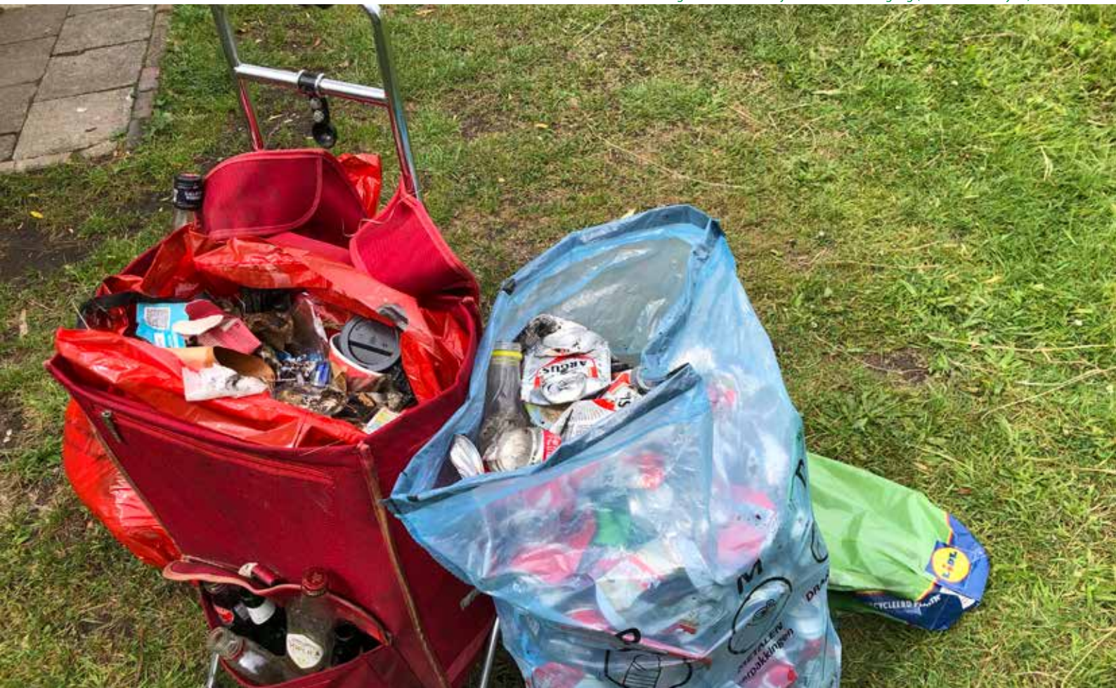
"Oogst" van een wekelijkse zwerfvuil-rondgang

We hebben in Antwerpen geen 'ongerepte' natuur. Laten we dit kleine gebied niet overbelasten met onze aanwezigheid (blijf dus op de paden van minstens één meter breed, ga niet zomaar ergens het bos in) en laat in geen geval je afval achter. Er staat een vuilbak aan de ingang van Wolvenberg en aan de voetgangersbrug. En geniet van deze natuur! ■