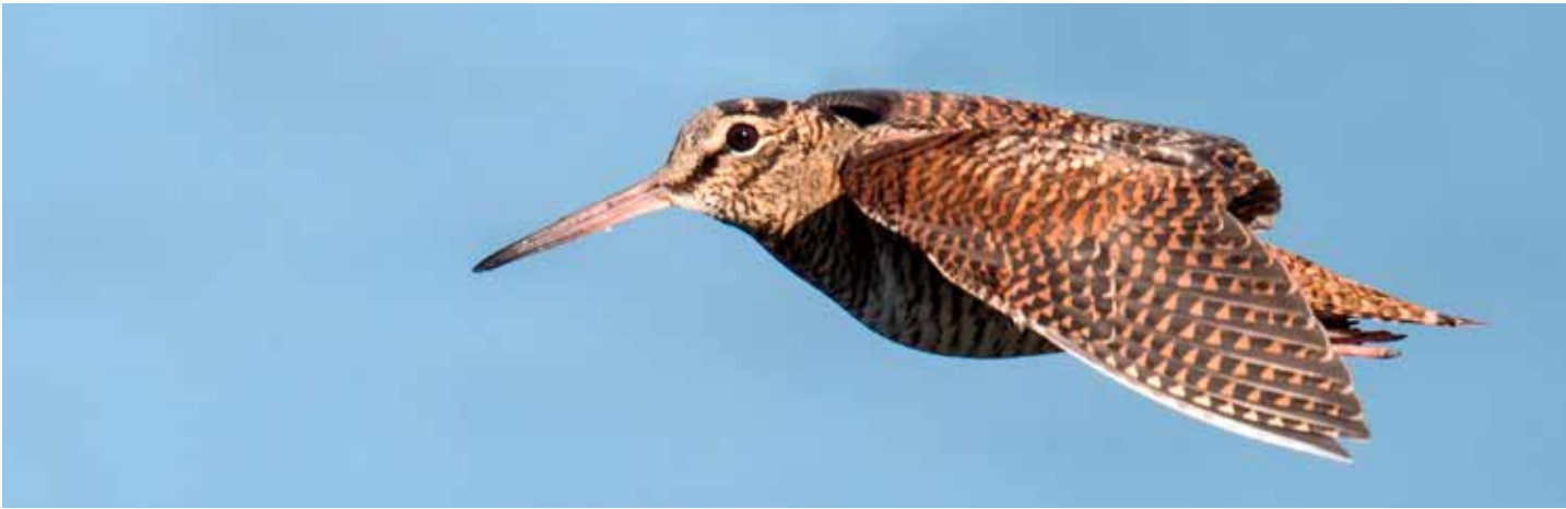
Houtsnip in vlucht

De houtsnip is echt geen stadsvogel. Toch worden er in Antwerpen elk jaar wel een drietal waargenomen. In 2018 en 2021 waren er zelfs 11 waarnemingen. Vooral in maart en november, tijdens de vogeltrek, vliegen ze wel eens over de stad. Een enkele keer worden ze dan waargenomen tijdens één van hun rustpauzes. Maar meestal zijn de omstandigheden dramatischer.