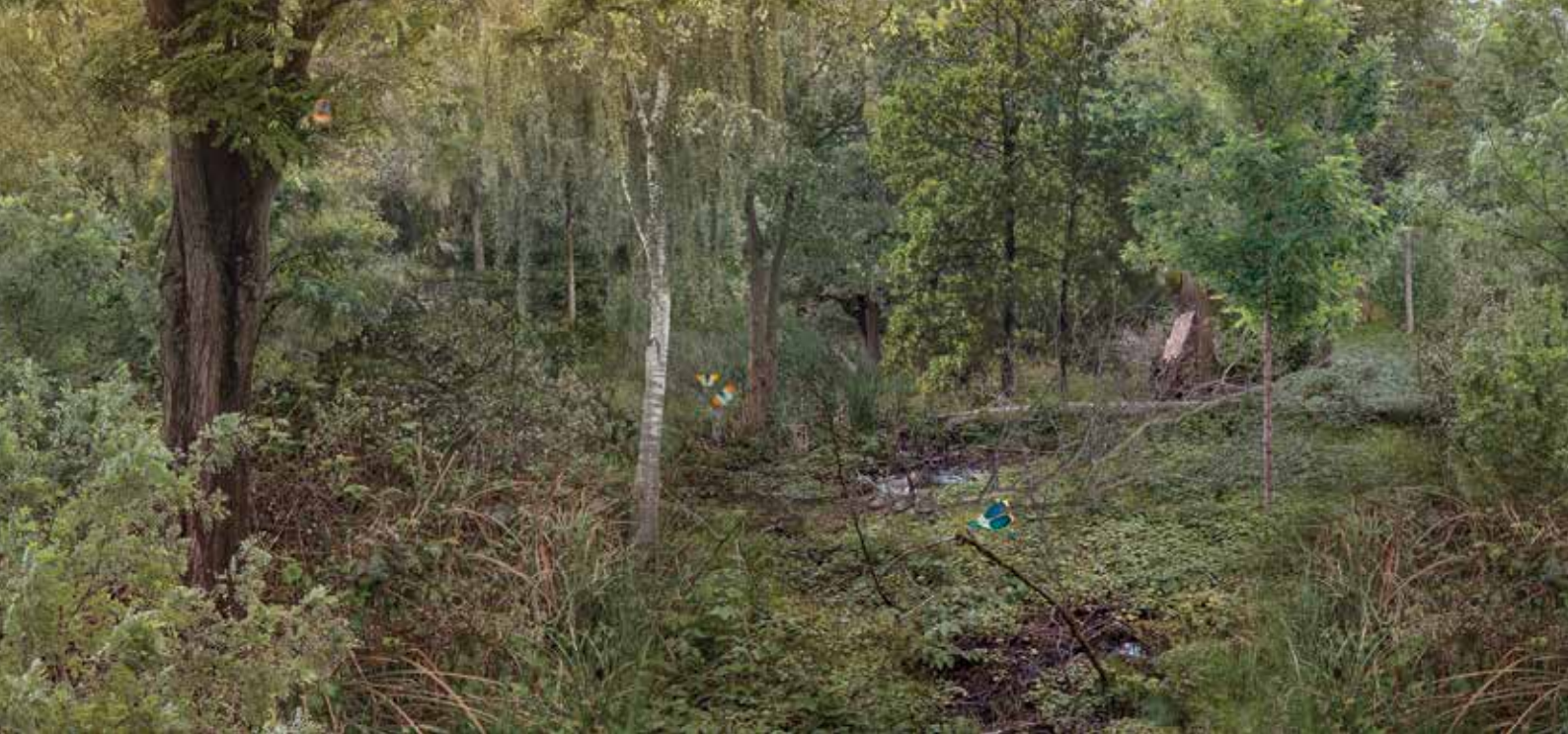
Wolvenberg: huidige toestand centraal habitatype