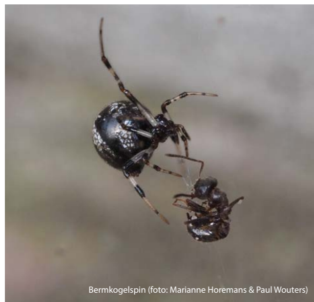
Bermkogelspin