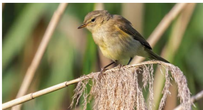
De tjiftjaf komt al vroeg in het voorjaar terug vanuit het zuiden

Zang- en roofvogels uit het noorden steken massaal de Oostzee over vanuit Falsterbo in Zweden. Het is één van de beste plekken in Europa om de vogeltrek te bewonderen. Vogels die vanuit Europa naar Afrika reizen zoeken vaak de kortste oversteek aan de gevaarlijke Middellandse Zee. Zij volgen de laars van Italië of steken over aan de Straat van Gibraltar. Een heel drukke trekroute loopt ten oosten van de Middellandse Zee over Israël.