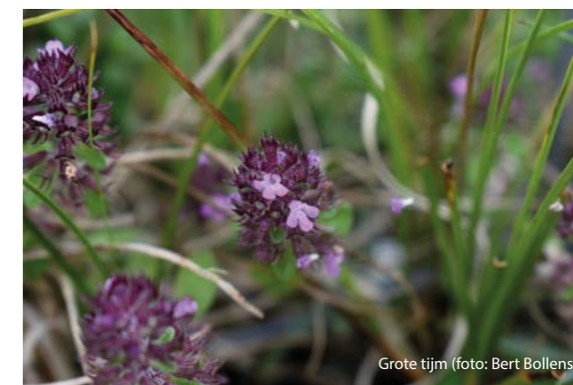
Grote tijm