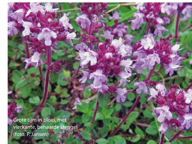
Grote tijm in bloei, met vierkante, behaarde stengel

Grote tijm is een zeer lekker en populair kruid bij slaatjes, vis- en vleeschotels. Ook omeletten en gerechten met aardappelen of paddenstoelen smaken beter met tijm. Zelfs de bloemetjes kan je mengen in slaatjes en visschotels. Tijmbladeren kunnen gedroogd worden om ze later te gebruiken. Tijm als thee in de ochtend laat je de dag fris en monter beginnen! ■