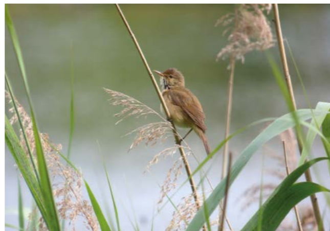
De kleine karrekiet voelt zich thuis in het riet

De Oude Landen maakte oorspronkelijk deel uit van de uitgestrekte Scheldepolders ten noorden van Antwerpen. De expansie van de haven en de uitbouw van een spoorwegcomplex beten grote hapen uit de polders. Dat de Oude Landen daaraan ontsnapte is mee te danken aan de krijgsmacht die net voor WOII het gebied inpalmde als militair oefenterrein. In 1968 verkochten de militairen de Oude Landen aan het Antwerpse stadsbestuur. Dat had plannen om er een woonwijk te bouwen. De omwonenden en een groepje natuurbeschermers kwamen in het verweer. Met succes. In de daarop volgende decennia werd de Oude Landen uitgebouwd tot een waardevol stedelijk natuurgebied.