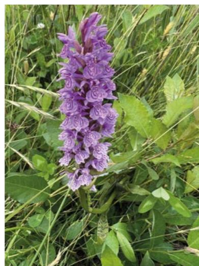
Kalkrijk kwelwater doet o.a. rietorchis gedijen

Het halfopen landschap kent een grote verscheidenheid: bos, struweel, ruigtes, grasland. Dat levert een zeer rijke vegetatie op. Op een aantal plekken komt kalkrijk kwelwater aan de oppervlakte. Dat is één van de ingrediënten voor wilde orchideeënsoorten: moeraswespenorchis, rietorchis, vleeskleurige orchis, gevlekte orchis, grote keverorchis en bijenorchis vind je zo naast de wandelpaden. Het gebied staat ook bekend om uitbundige ruigtekruiden zoals fluitenkruid en koninginnenkruid, die massa's insecten aantrekken. Door het vele riet zijn er natuurlijk heel wat rietvogels zoals de kleine karekiet, de blauwborst, de bosrietzanger en de rietgors. Tussen al die wilde natuur loopt een kleine kudde Galloway-runderen die van juli tot december grazend een handje helpen bij het beheer.