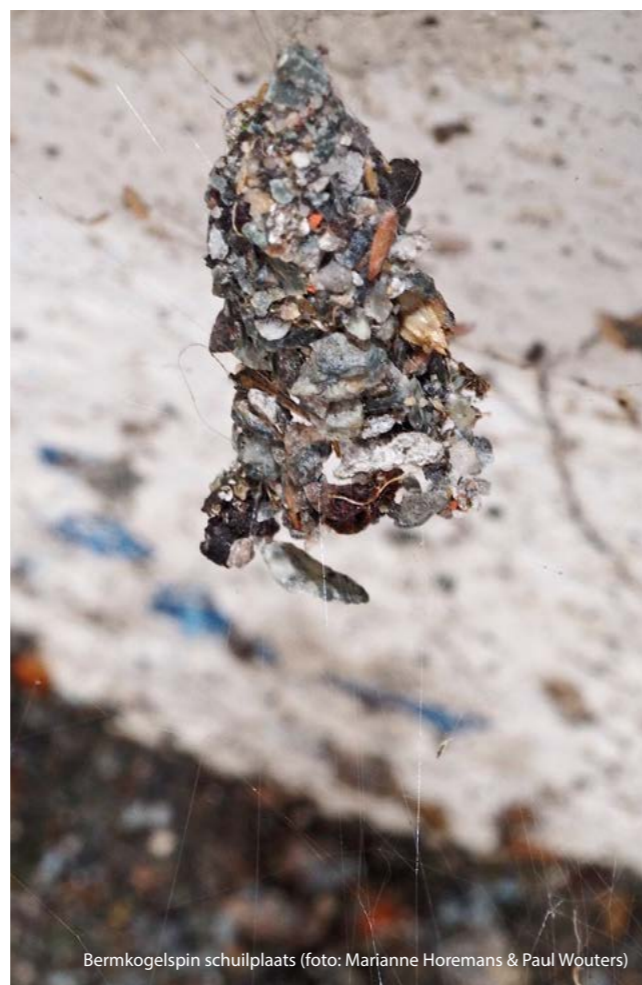
Bermkogelspin schuilplaats

De vondst van een bermkogelspin in de 'volle stad' (Boomgaardstraat) is bijzonder omdat die plaats niet overeenkomt met de natuurlijke habitat van deze soort. Ze werd ook niet aangetroffen tijdens het intensieve, 4 jaar durende spinnen-onderzoek binnen de Antwerpse ring. Vermoedelijk gaat het dan ook om een exemplaar dat meegereisd is met bv. planten ergens uit de Kempen.