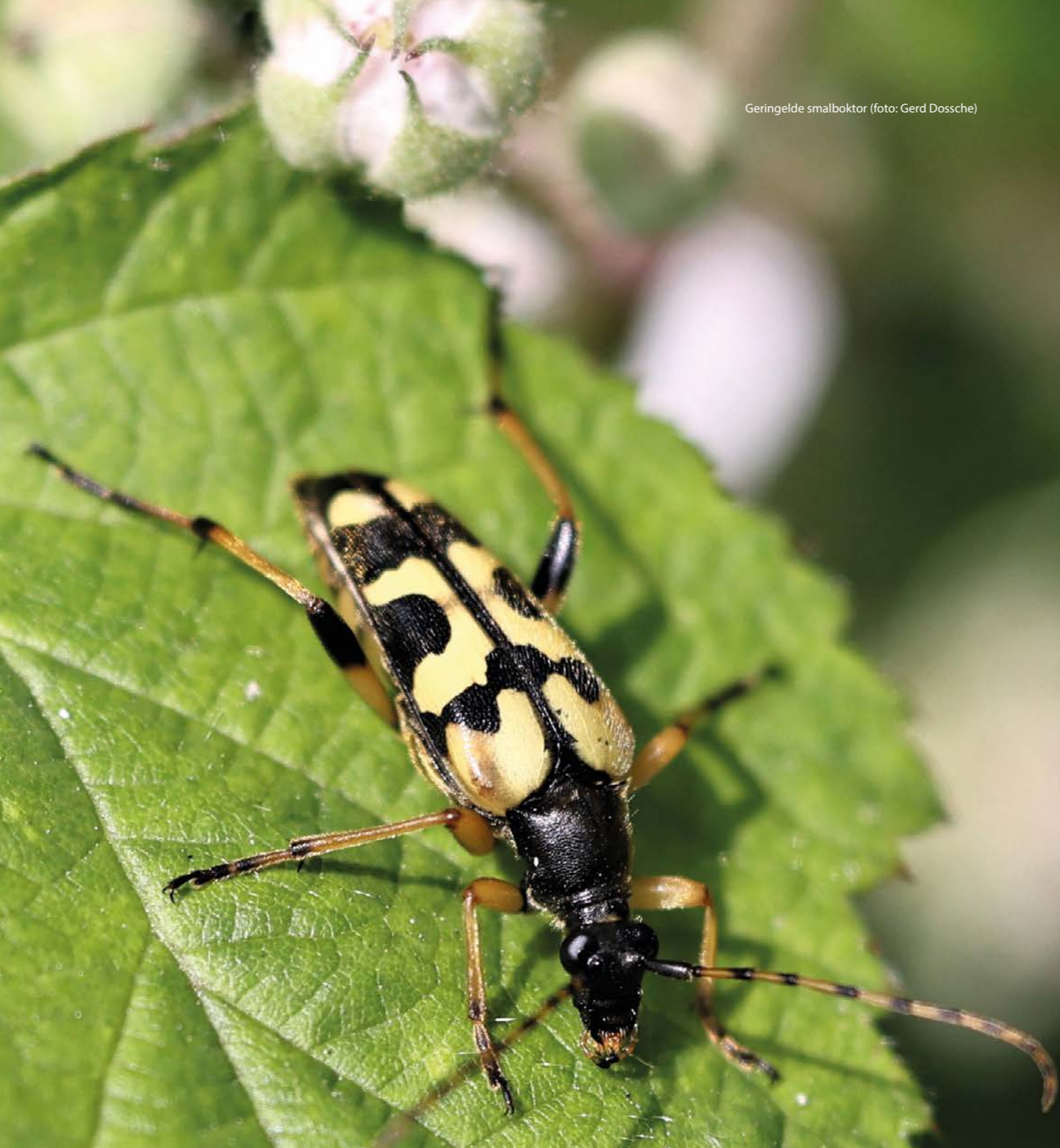
Geringelde smalboktor