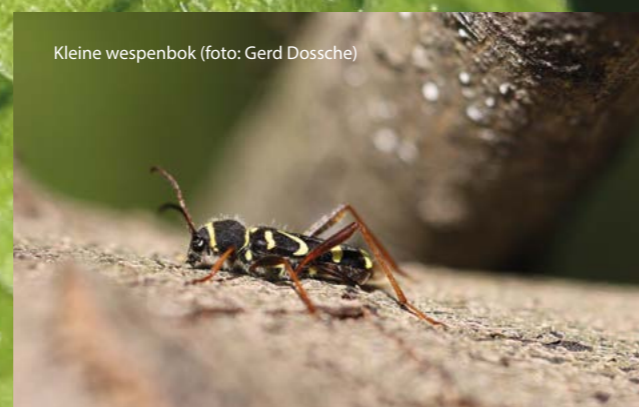
Kleine wespenbok