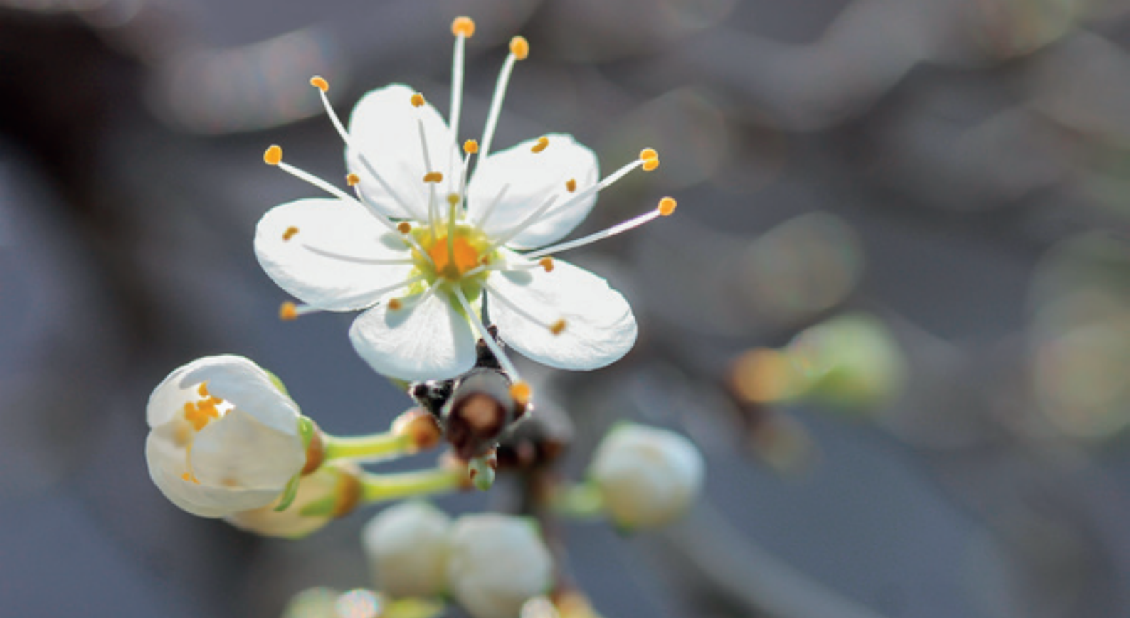
Bloesem van Sleedoorn

De professionele ploeg uit Ekeren komt een aantal populieren langs het pad opruimen, maar de werken nemen meer tijd in dan voorzien.