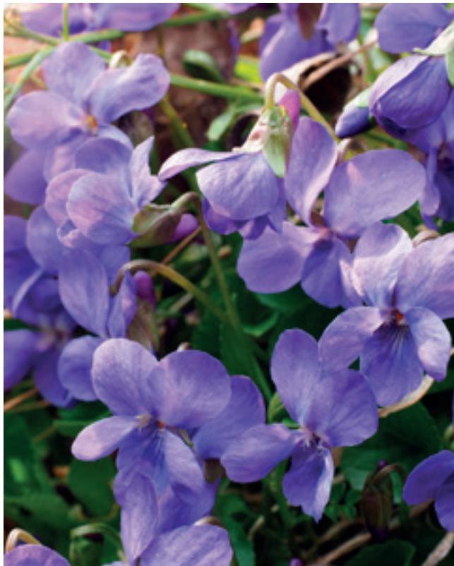
Maarts viooltje

Ook tijdens de winter kunnen we planten monitoren. Chinese waaierpalm is wintergroen, dus de jonge planten zijn nu goed zichtbaar. We doen tellingen in en rond de Botanische tuin, waar al jaren vruchten massaal kiemen.