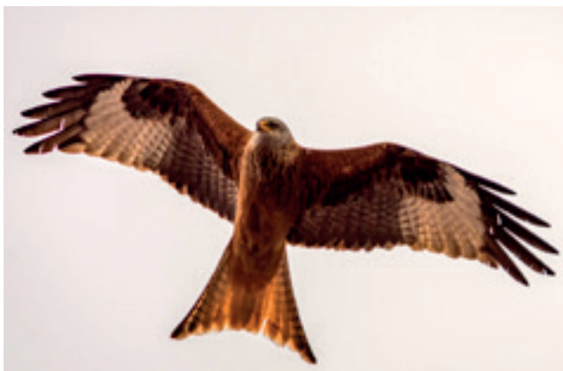
Rode wouw

In Vlaanderen is de Rode wouw slechts een toevallige broedvogel. Het is een trekvogel, die in het najaar voor overwintering vertrekt naar Zuidwest-Europa of Noord-Afrika.