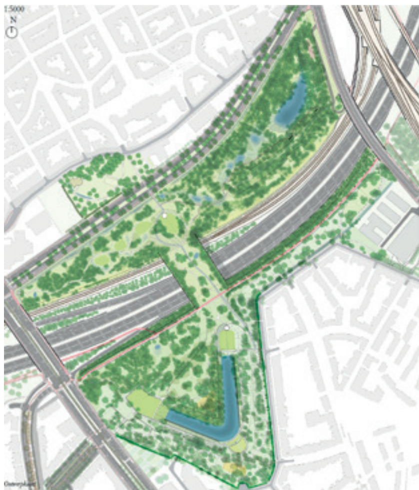
Ontwerpkartaal uit het Masterplan Brialmont (grafiek: Cluster & Witteveen+Bos)

Onze belangrijkste bekommernis was dat de plannen en ingrepen die men voor het gebied in petto had, geen afbreuk zouden doen aan het natuurbeheer dat onze beheerploeg al tientallen jaren uitvoert op Wolvenberg. Dat beheer is erop gericht om verschillende vormen van lokale natuur kansen te geven. De boodschap werd duidelijk meegegeven aan de politici, de administratie en het geëngageerde ontwerpteam. We gingen verschillende keren met hen op terreinbezoek om duidelijk de aanwezige natuurwaarden in kaart te brengen.