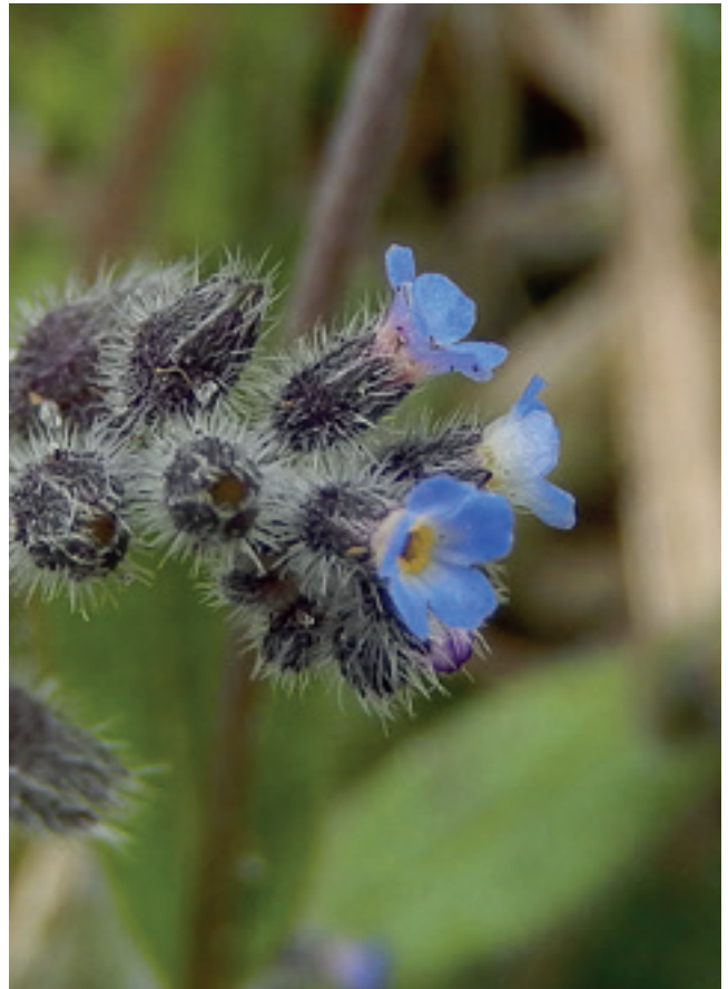
Ruw vergeet-me-nietje