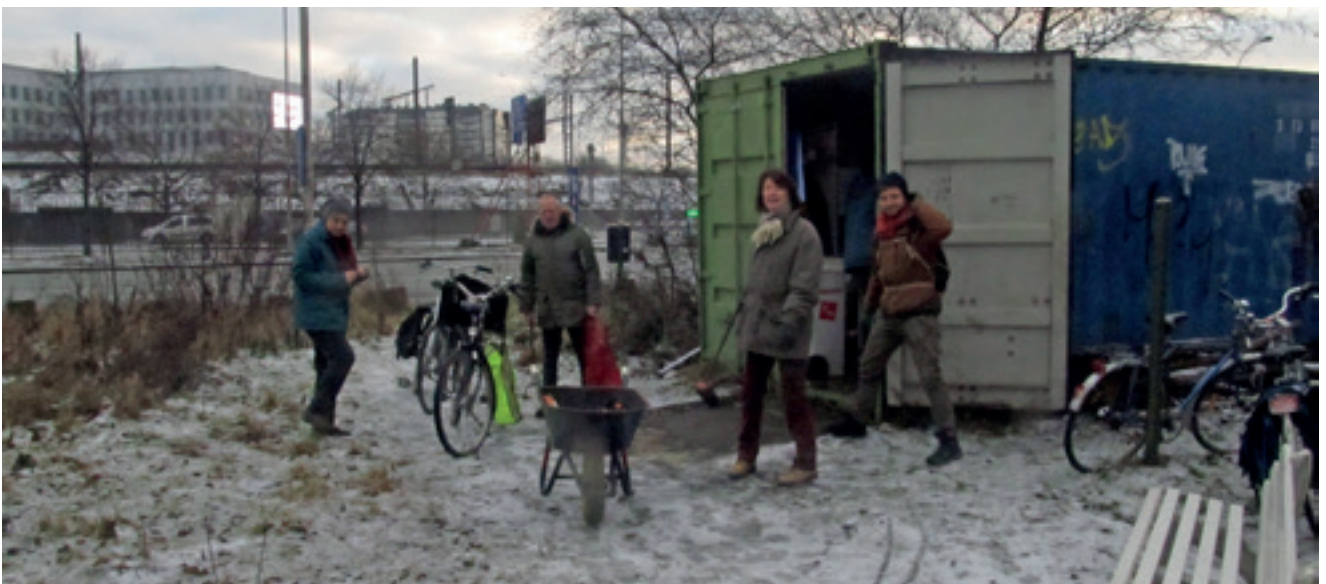
Beheerploeg verzamelt in de sneeuw aan de Wolvenbergcontainer

Onze laatste beheerdag is zonovergoten en de vogels, onbewust van het deze nacht ingevoerde zomerruuk, jubelen luider dan ooit in de ijzige morgen. Naast het opruimen van een grote stapel kruinhout en het massaal uittrekken van de duizenden kiemplanten van Oosterse kornoelje, wordt er verder gewerkt aan het hek bij het populierenbos. ■