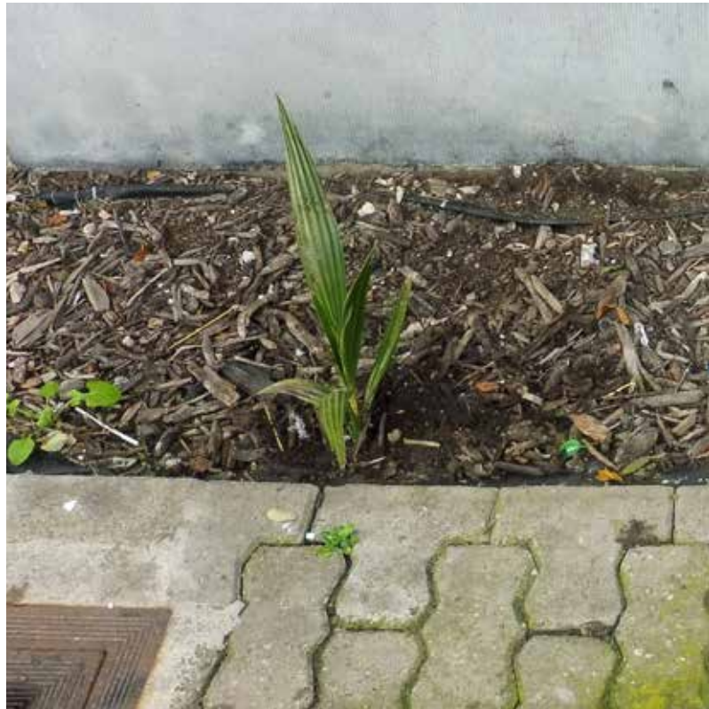
Een zaailing van Chinese waaierpalm