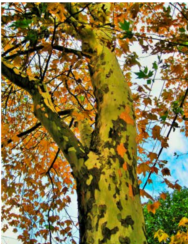
De Plataan herbergt bij ons bijzonder weinig biodiversiteit.

3de editie inheemse plantenmarkt zondag 30 april 2017 van 10 u tot 17 u Plein Kloosterstraat-Goedehoopstraat 2000 Antwerpen Alle info en voorafbestellingen: www.wilderisbeter.be