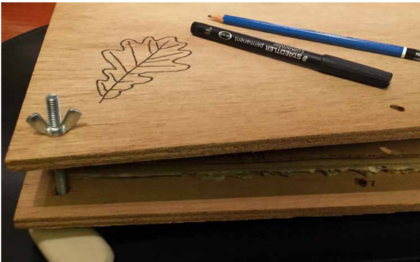
Getekend eikenblad als versiering

Terwijl je planten drogen, kan je een geschikt schriftje uitzoeken of een tekenblok, waar je later een herbarium van zal maken. Je kan bladeren en bloemen natekenen. Tenslotte kan je ook de bovenste plank van je plantenpers versieren met tekeningen. Teken eerst met potlood, ga er daarna over met een alcoholstift. Veel plezier! ■