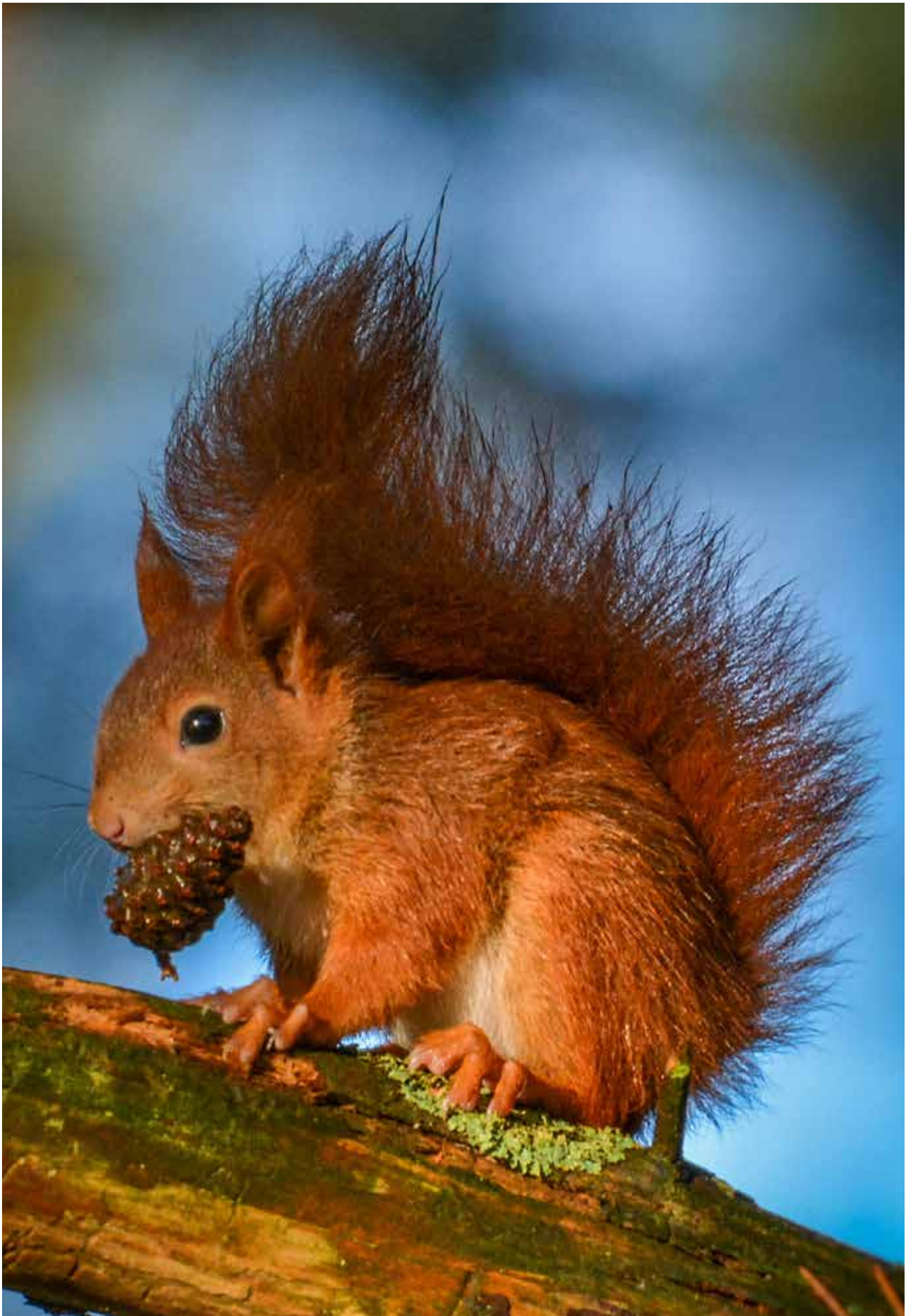
Rode eekhoorn