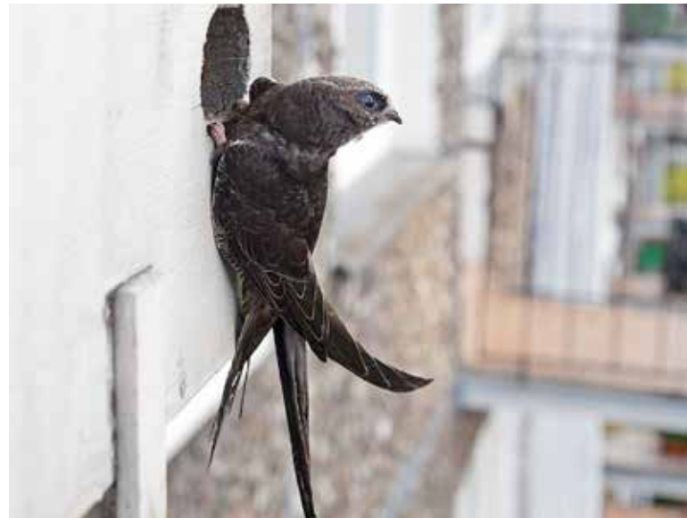
Gierzwaluw aan nestkast

Op de website gierzwaluwbescherming.nl kan je nog meer informatie vinden.