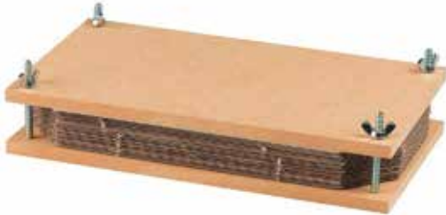
Voltooide plantenpers

Voor een beginnende plantkundige is een oud woordenboek ideaal om planten te drogen en glad te krijgen. Maar oude boeken zijn kostbaar en misschien vergeet je wel dat je bladeren erin zaten, of gooit iemand ze per ongeluk weg. Een plantenpers maken is echt niet moeilijk, en je gebruikt er gerecycleerd materiaal voor. Het is dus ook milieuvriendelijk.