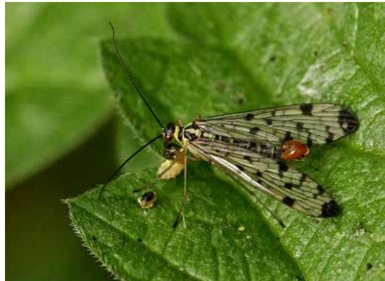
Duitse schorpioenvlieg

In Antwerpen is deze soort gevonden in de Wolvenberg en dat is ook logisch want schorpioenvliegen tref je vooral aan in bossen en struwelen. ■