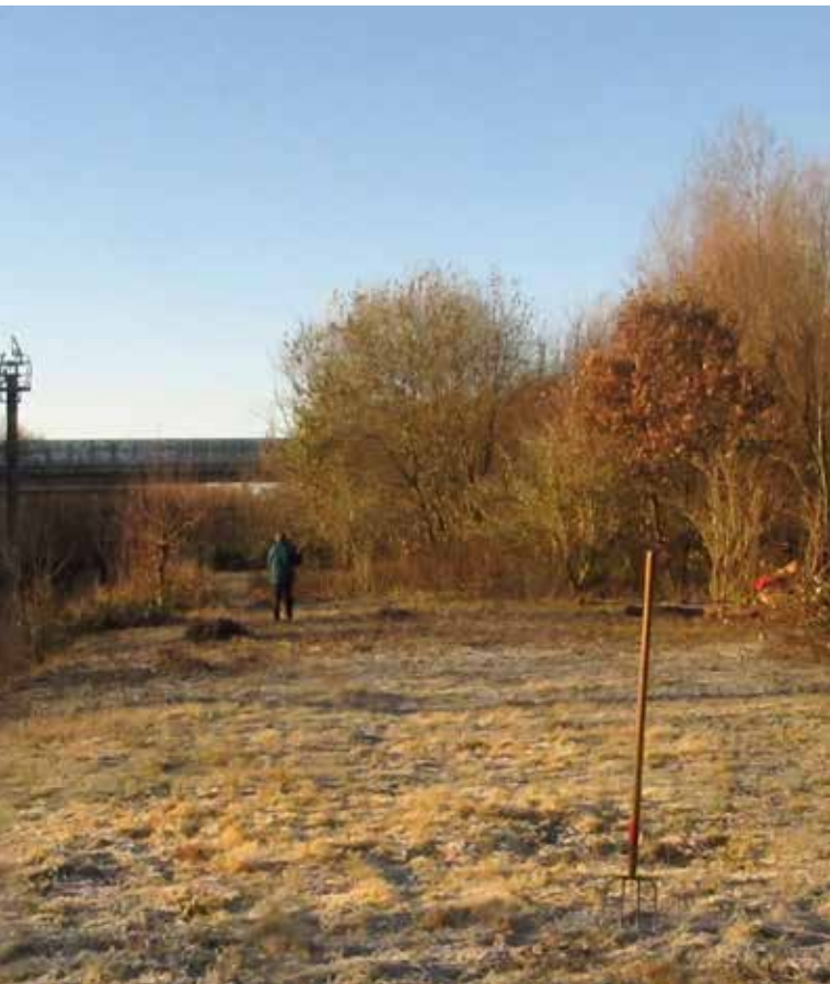
Jonge graslanden in grondvorst op Wolvenberg

Met een groepje van FONAS bezoeken we op het Eilandje de droogdokken voor een dieper onderzoek van de oude muren, waar we in september Zachte naaldvaren gingen controleren. Met de zegen van de saswachter betreden we een voor het publiek verboden terrein. Sommige droogdokken zijn rijkelijk begroeid en zeer gevarieerd. Vooral in de oude bouwsels met windassen voor de sluisdeuren komt een overvloed aan varens voor. Tot onze verrassing staat de kade er echt vol met bloeiende Herfstbitterling, begeleid door een kleinere hoeveelheid Echt duizendguldenkruid. In het water danst een massavegetatie van Veelwortelig kroos een trage wals rond de sluisen.