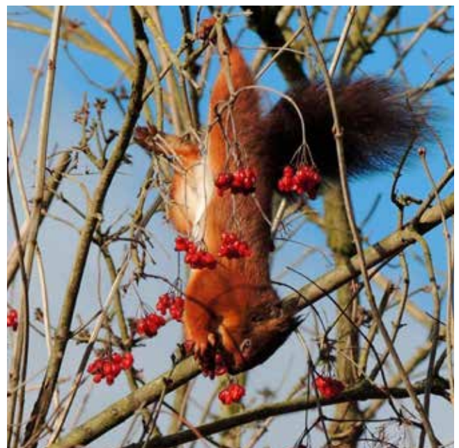
Etende Rode eekhoorn

De Eekhoorn is in de zomer vooral zo'n twee uur na zonsopgang en twee uur voor zonsondergang druk met het zoeken van voedsel. Daartussen slaapt hij vaak of is hij bezig zijn nest te verbouwen. Hij neemt ook veel tijd om zijn vacht te verzorgen. Gemiddeld gebruiken de mannetjes daar dubbel zoveel tijd voor dan de vrouwtjes! In de winter zijn de Eekhoorns meestal alleen actief in de morgen. Ze houden echter geen winterslaap.