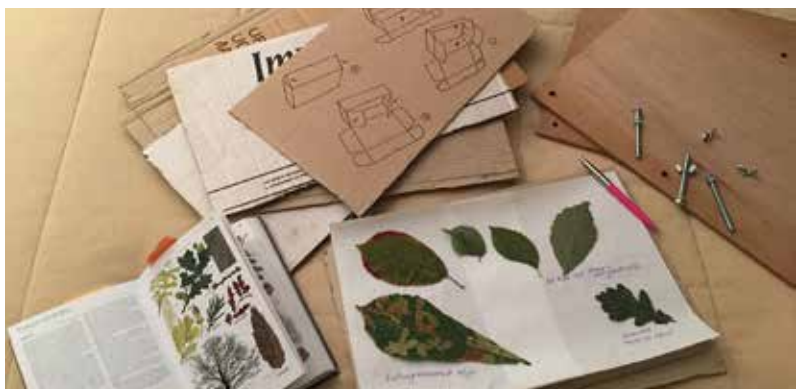
Wat heb je nodig om een plantenpers te maken?

Eerst ga je de natuur in. Daar verzamel je allerlei bladeren of bloemen die je mooi vindt of waar je meer over wil weten. Denk eraan dat je zoveel mogelijk verzamelt wat gewoon op de grond ligt zodat je zo weinig mogelijk hoeft te plukken. Als het niet anders kan, kijk je goed of er voldoende planten staan van één soort en laat je de wortel zitten zodat de plant nadien verder kan groeien. Let goed op dat je geen zeldzame planten plukt. Vraag aan een volwassene om dit op te zoeken op het internet; vraag het aan een natuurgids of aan de conservator. Weet je niet welke plant het is, laat ze dan gewoon staan. Steek de bladeren meteen in een kartonnen zak of nog beter tussen vellen krantenpapier. Zeker geen plasticen zak want dan krijg je schimmelgroei op je bladeren. Thuis kan je in een boek opzoeken over welke plant het gaat. Heb je geen boek over planten en bomen, dan vindt je dat vast in de bibliotheek. Schrijf dat er in het klad even bij.