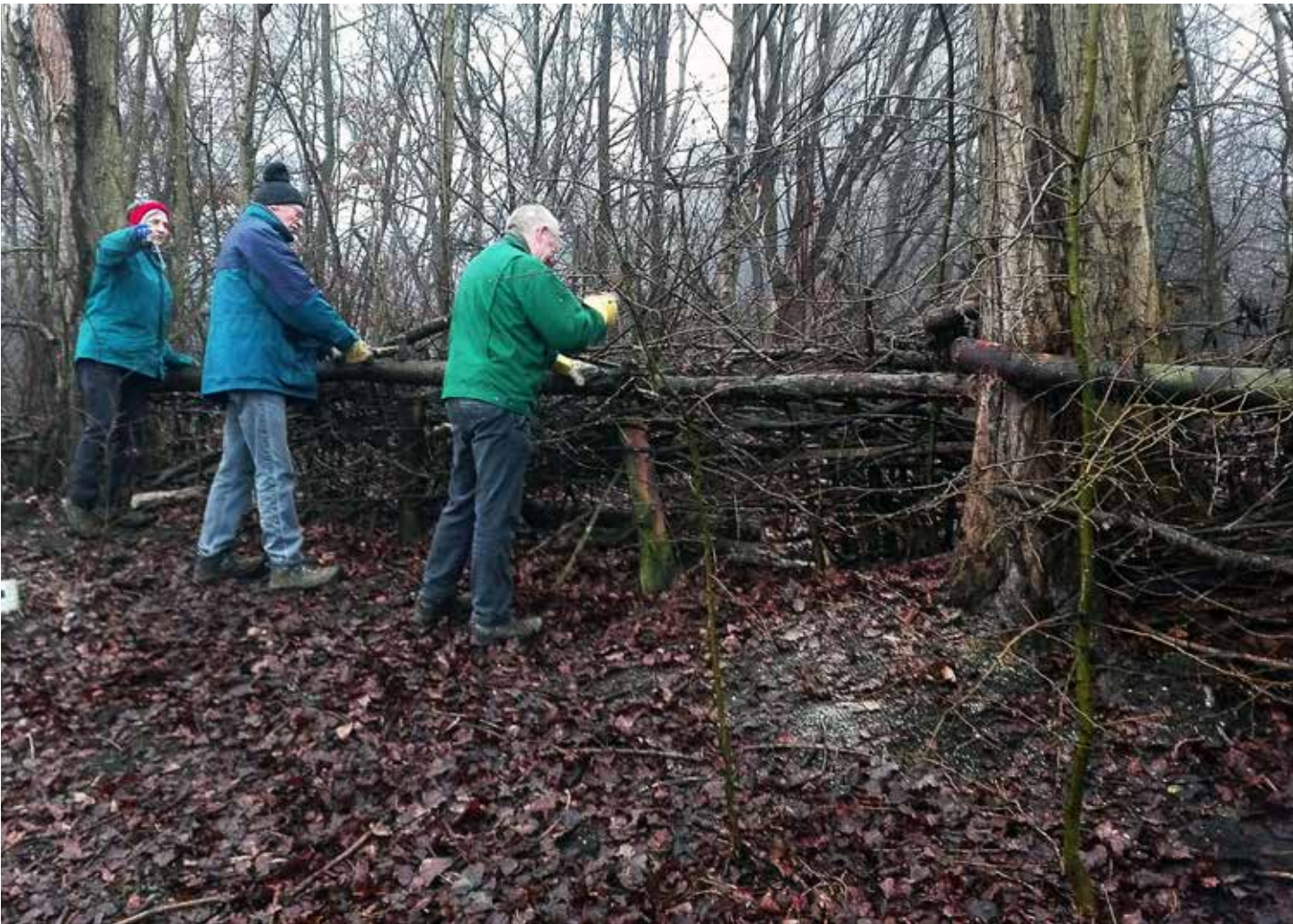
Nieuw hekwerk aan de buitenrand van Wolvenberg op de laatste beheerdag van 2016