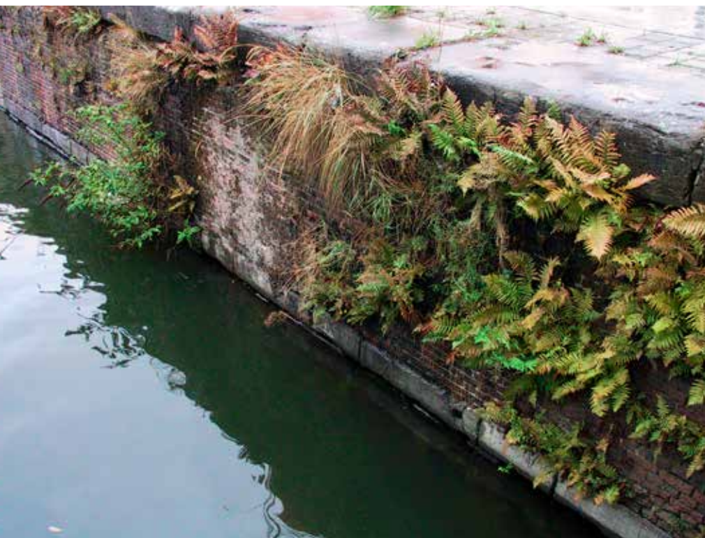
Onschuldige muurflora (varens,...) en schadelijke houtige gewassen (Vlinderstruik,...)