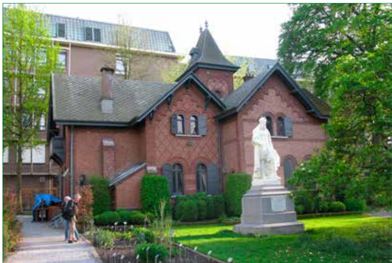
Standbeeld Peter van Coudenberghe naast “Het Gebaar”

Sinds 1950 is de tuin beschermd als monument: alle afgestorven bomen en planten worden vervangen door een soortgenoot. Dat niet alle soorten inheems zijn, is historisch bepaald. Bij zijn oprichting eind 19de eeuw voorzag de tuin het nabijgelegen ziekenhuis van geneeskrachtige planten. Daarna werd hij omgevormd tot een wetenschappelijke hortus botanicus, met zoveel mogelijk inheemse én uitheemse