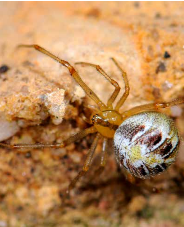
Grote wigwamspinn