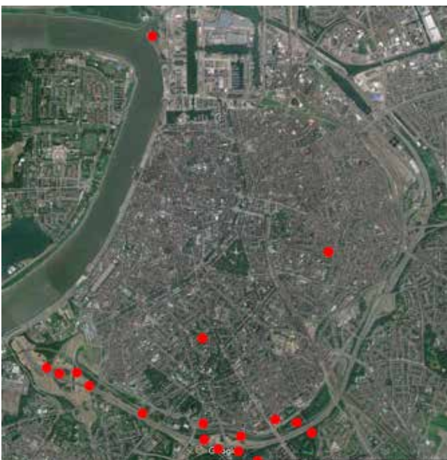
Figuur 1. Gekende vindplaatsen van Vos in de stad

De kans is reëel dat we in Antwerpen nog meer meldingen gaan zien van Vos. Voor zover als nodig, willen we hier nog eens beklemtonen dat de aanwezigheid van vossen op zich geen risico's inhoudt voor de mens. Hopelijk krijgen sommigen echter niet de goedbedoelde reflex om de dieren te beginnen voederen. Zoiets vergroot immers het risico dat de dieren afhankelijk worden van dat voedselaanbod en dat zich op een bepaald moment door een overvloed aan voedsel te dichte populaties gaan ontwikkelen, waardoor er wél overlast kan ontstaan. ■