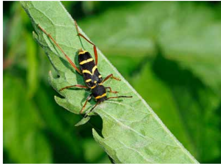
Kleine wespenbok (foto: Paul &amp; Marianne Wouters-Horemans)

De soort lijkt op een wesp en beschermt zich zo tegen aanvallers, die misleid worden. Dat nabootsen van "gevaarlijke" insecten door niet gevaarlijke, noemt men mimicry. Bovendien zijn het niet alleen de kleuren van de kever die aan een wesp doen denken. Hij gedraagt zich ook zo, door zich in drukke, korte rukjes voort te bewegen en zelfs de vlucht van een wesp na te bootsen.