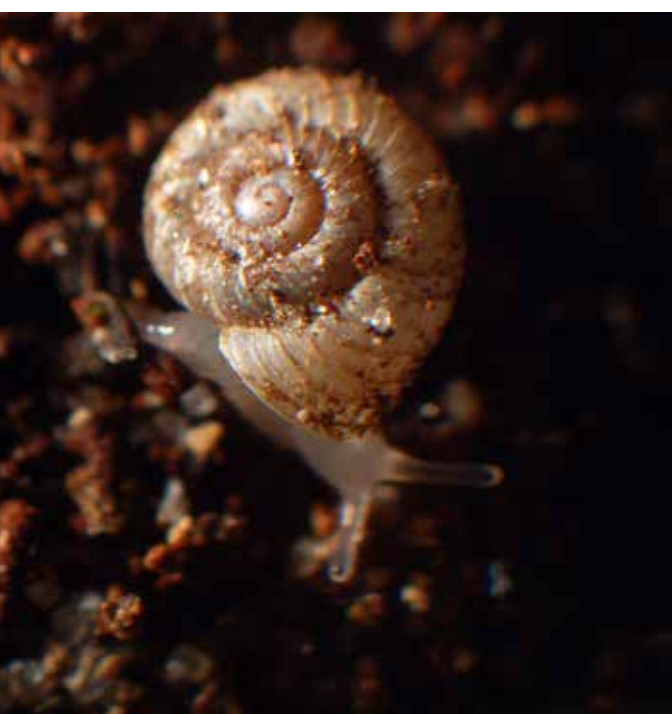
Geribde jachthoornslak