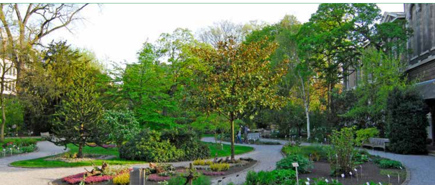
Zicht op het centrale deel