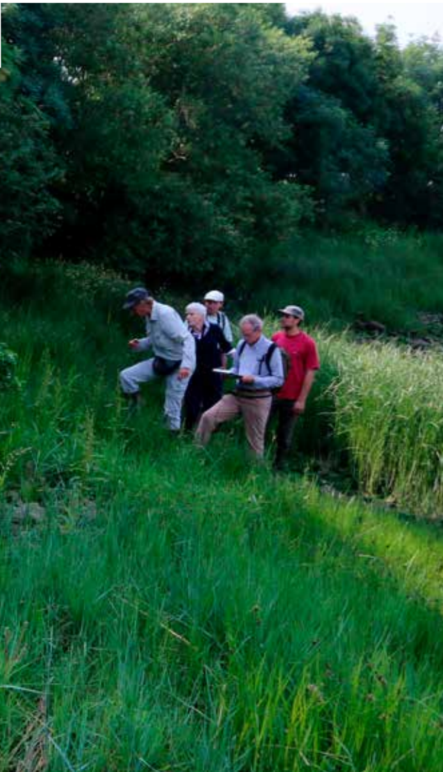
Onderzoek aan de stadsschorren

Om een toekomstig beheer van de graslanden aan de Stenenbrug op te stellen, gaan we naar de snelweg. Als we er aankomen wordt er net op dit perceel geklepeld (= machinaal snoeien van ruig struikgewas). Tot onze verrassing vinden we er o.a. Bijenorchis en Hokjespeul in bloei. Moedig vraag ik de arbeider om de populatie te ontzien, daar er een fout in het maaischema zit. De brave man rijdt voorzichtig rond de zeldzaamheden. Nu nog een juist beheer plannen: maaien ja, klepelen nee! ■