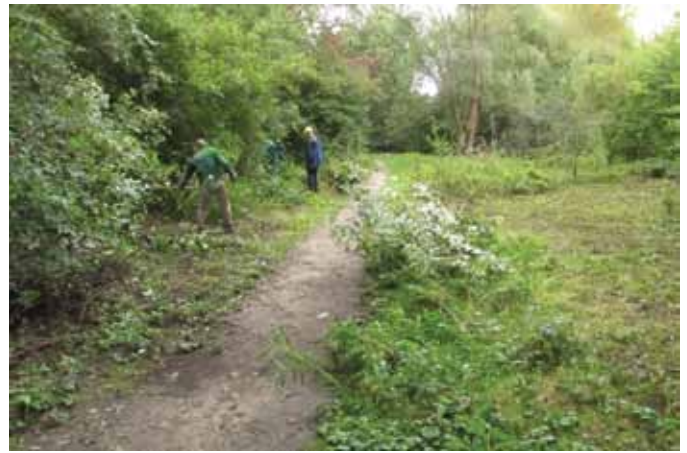
Opruimen exotenhaarden op Wolvenberg

Als tussendoortje monitoren we de pioniervegetaties langs het nieuwe fietspad op de Singel, deels in een urenlange wolkbreuk, deels in de stralende zon. Tussen al de vreemde zeldzaamheden vermelden we toch ook dat Esdoornganzenvoet in vele stukken voorkomt, en dat deze op de Rode Lijst vermeld staat als zeldzaam. Aan de Borsbeekbrug ligt een fraai en divers perceel met open grasland. Op het moment van onderzoek blijkt dat er al plannen bestaan om dit om te vormen tot een parkje. Opnieuw staat er een hele lijst met bomen op het menu die hier niet altijd even goed thuis horen. We boden de bevoegde districtsschepen aan om advies te verlenen omtrent het behoud van de aanwezige natuurwaarden. Het is spijtig dat we hiervoor niet gevraagd werden in de cruciale fase van opmaak van het inrichtingsplan.