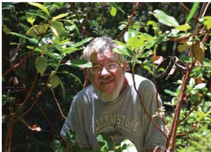
De natuur in Guy

Natuurbescherming en algemene bezorgdheid om het milieu, het klimaat en onze planeet zijn nooit een