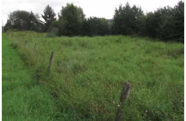
De ruige graslanden op het Prieel onder beheer van onze afdeling

gezorgd, die bescheiden in bloei staat en een omvang van 10 m 2 heeft bereikt. Overal verschijnen Veldkruidkers, Bermooievaarsbek en verse pollen Bermzegge. Veel Vlier staat in bloei, maar er is ook een opvallende sterfte bezig. Naast de bekende lepenziekte, die vanaf bepaalde omvang plots de fiere boom doet verdorren, lijken we nu ook last te gaan krijgen van Essentaksterfte. Op de zwartgeworden bladstelen van de Es groeien minuscule witte paddenstoeltjes, Vals essenvlieskelkje. Ook Spaanse aak, een siersoort (cultivar) met een min of meer inheems karakter, kan plots verdorren, terwijl andere nabije soortgenoten alleen wat vraatschade ondervinden van rupsen. De aanhoudende droogte heeft er natuurlijk ook veel kwaad aan gedaan. In onze ploeg verschijnen toch enkele verse krachten, altijd belangrijk voor de continuïteit van onze beheertaak.