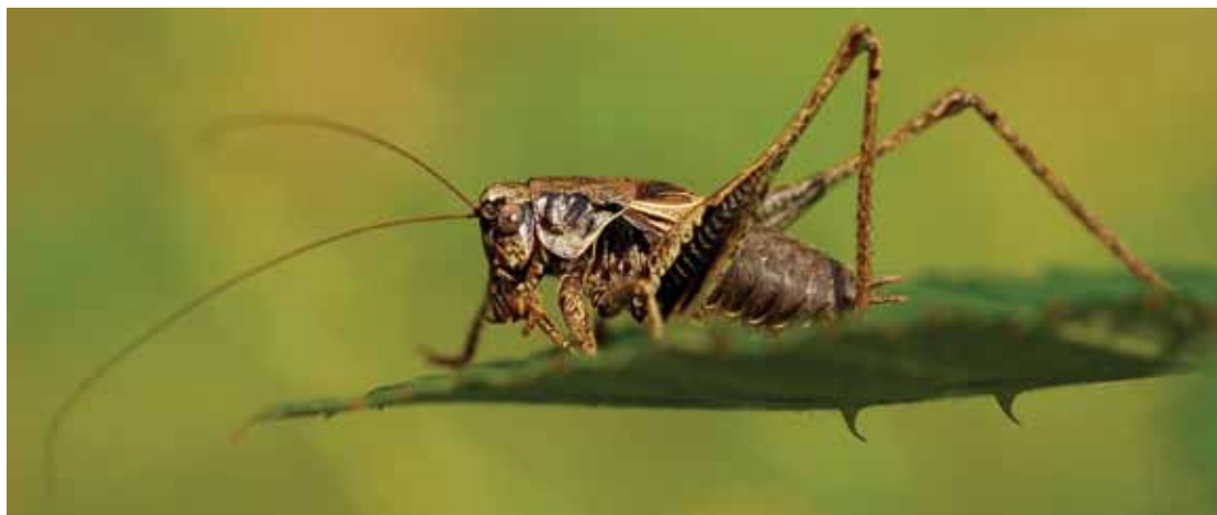
Bramensprinkhaan ( Pholidoptera griseoptera )

boomsprinkhaan vanuit het zuiden in onze steden terecht met de hulp van auto's, caravans en mobilhomes. Deze soort houdt van een warmer klimaat en wordt voornamelijk in stedelijke milieus aangetroffen, waar de temperatuur gemiddeld enkele graden hoger is. Ook de Zuidelijke boomsprinkhaan valt te verwarren met een soort die al geruime tijd in onze regionen aanwezig is: de Boomsprinkhaan. Onze 'inheemse' Boomsprinkhaan heeft echter veel langere vleugels dan zijn zuidelijke tegenhanger. Vermits beide soorten vaak op licht afkomen, kan je ze wel eens binnenshuis waarnemen.