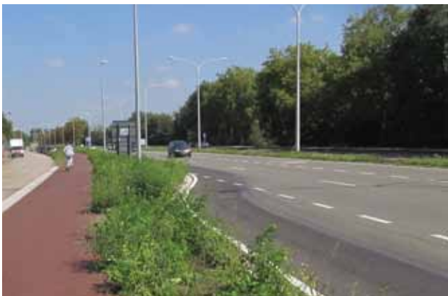
Uitbundige bloei van akkerflora langs het nieuwe Singelfietspad, met tal van Rode Lijstsoorten

Op de graslandjes langs het spoor heeft het jarenlange beheer voor de expansie van de populatie Aardaker