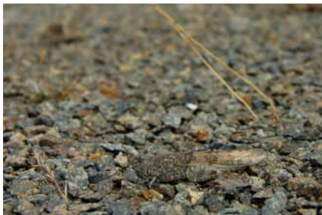
Kiezelsprinkhaan ( Spingtonotus caeruleus )

Ook andere soorten 'reizen' met menselijke transportmiddelen. Zo kwam de Zuidelijke