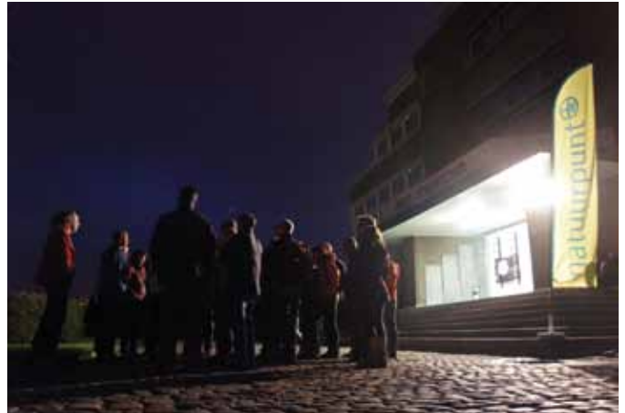
Start van de spannende rondleiding

begon de vleermuizenwandeling met batdetectors. Met behulp van een batdetector kan het geluid van een vleermuis (ultrasoon) hoorbaar gemaakt worden. Vleermuizen roepen immers zeer hard (tot 100 db!) maar onhoorbaar voor het menselijk oor. Zij gebruiken dit geluid en vangen de echo's op om in het donker hun prooi te vinden. Zodra ze dicht genoeg bij hun prooi zijn, scheppen ze die met een vleugel of hun staart om op te eten. De vleermuizen ontbraken niet op het appel: met vele tientallen (honderden?) vlogen ze over de vijver. Er waren dwergvleermuizen, watervleermuizen en franjestaarten.