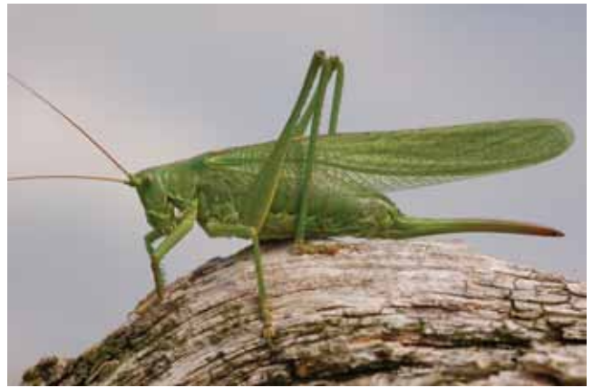
Grote groene sabelsprinkhaan ( Tettigonia viridissima )