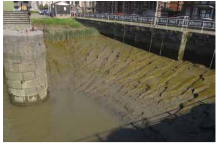
De geulen in het slik en het begroeid schor van het getijdendokje (Marguerie Schuilhaven)

Meld je aan op: info@natuurpuntantwerpenstad.be