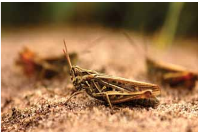
Ratelaar ( Chorthippus biguttulus )

In tegenstelling tot de meeste sprinkhanensoorten valt de Bruine sprinkhaan amper te determineren op basis van zijn uiterlijk. Zo zijn vrouwtjes van Bruine sprinkhaan, Snortikker en Ratelaar zelfs niet tot op soort te brengen. De Snortikker is de enige van deze drie die niet in de stad voorkomt. De mannetjes vallen echter eenvoudig op basis van geluid te onderscheiden: het geluid van de Bruine sprinkhaan is een korte 'zzt', dat van de zeldzamere Snortikker bestaat uit een opeenvolging van tikjes en gesnor, en de Ratelaar kan herkend worden aan de lange ratel.