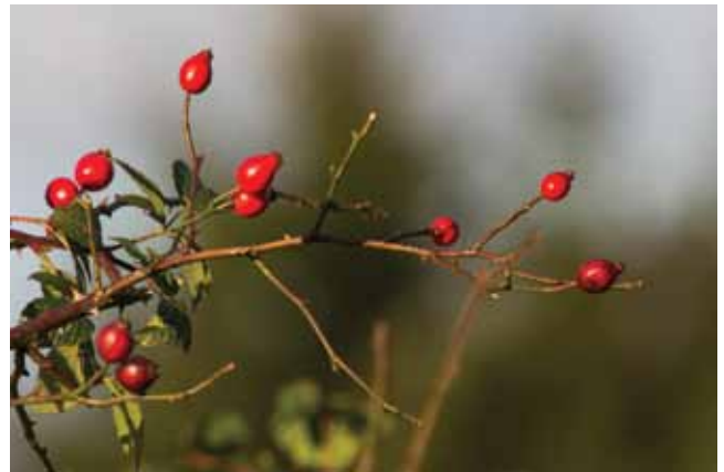
Rozenbottels van Hondsroos

Verdorrende kruiden hebben rijpe zaden. Die zitten vol kostbare plantaardige olie. Een ruigte -of het nu om een berm of een braakliggend stuk grond in de stad gaat- bezit tegen de winter een overvloed aan zaden en bessen die dieren -zoals veel vogelsoorten- in staat stelt om voor en tijdens de winter nog het nodige voedsel te vinden.