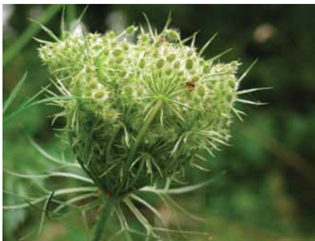
Rijpende zaden van Wilde peen

Hier en daar probeert men openbaar groen wat natuurlijker te laten ontwikkelen, maar in de praktijk zien we toch dat bv. de toepassing van het Bermbeheerplan nog al te vaak te wensen over laat. Dat Bermbeheerplan legt een aantal termijnen op waarbinnen de vegetatie in wegbermen al dan niet mag gemaaid worden. Wat bij de uitvoering nog dikwijls fout loopt, is de neiging van overheden om "kort de winter in" te gaan. Maaien net voor de winter is zowat het ergste wat je op het vlak van ecologisch bermbeheer kan doen.