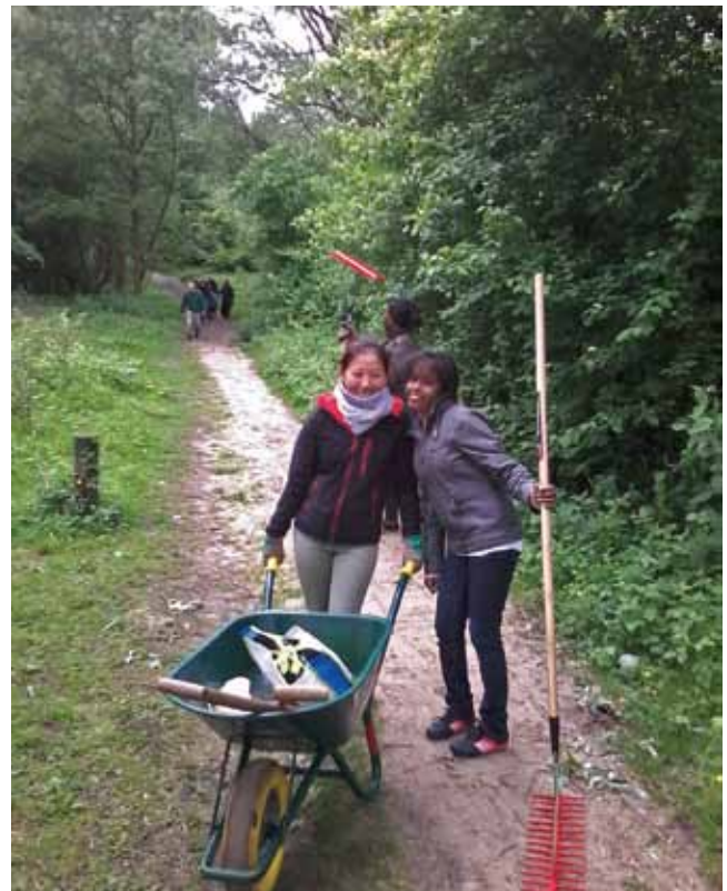
Het nuttige aan het aangename...

P.S. De volgende beheerdag, speciaal voor inburgeraars, is gepland op 16 november •