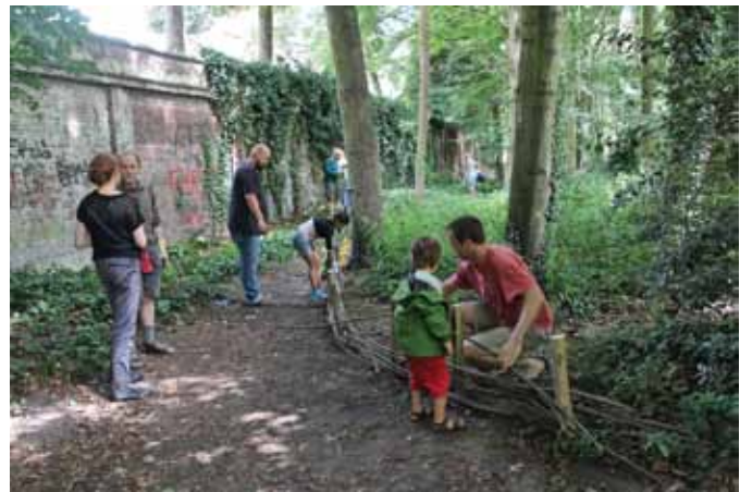
Ouders en kinderen leggen een takkenril aan.

Anderzijds zijn er ook afspraken gemaakt over de beheerwerken die de buurtbewoners onder begeleiding