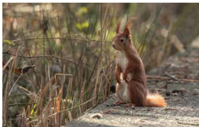
Ook de Eekhoorn kan je tuin bezoeken

putjes van ongeveer 3cm doorsnee, soms meerdere op een rij en deze worden volgestouwd met graan- of maïskorrels. Een Bosmuis eet haar voedsel vaak op eenzelfde eetplekje op. Veelal is dit onder struiken of bomen en soms gebruikt ze een oud vogelnest als plekje om rustig te kunnen eten. Zorg in je tuin voor voldoende beschutting zoals lage begroeiing of groepjes stenen zodat ze ertussen kan kruipen.