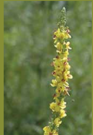
Zwarte toorts

Wees getroost. Hier zijn de Koningskaars, de Stalkaars en de Zwarte toorts. Van nature komen ze voor op vrij droge, kalkrijke, zandige open plaatsen, waar je ze van ver kunt zien reiken naar de zon, als om hun lange toortsen aan haar stralen te laten ontbranden. De viltige bladrozetten en grote stengelbladeren die de plant omkransen geven een krachtige structuur in de border of langs een kronkelend pad. Zet ze steeds in een groepje. Ook in een zonnige geveltuin komt de plant mooi tot zijn recht. Zelfs een plek tussen de straatstenen zou hij overwegen.