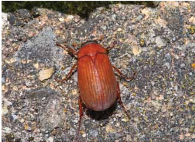
Roestbruine bladsprietkever