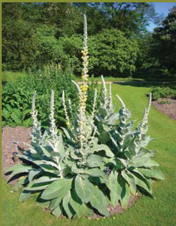
Stalkaars in parkomgeving.

Mogelijk ben jij een van de passievolle tuiniers die zin gekregen heeft in een natuurlijke tuin, maar toch aarzelt. Want zeg nu zelf, de wild wuivende kruidlaag in een natuurgebied mag dan al krioelen van speels leven, in de kleine stadstuin wil ik toch wat meer overzicht en structuur. En nog iets anders. Inheemse plantsoenen zijn best wel charmant in hun discrete bloei van honderden mini-bloempjes. Maar mis ik stiekem niet de imposante uitstraling van mijn schitterende dahlia's, mijn boenk-hortensia's en mijn trots tapijt van tulpen?