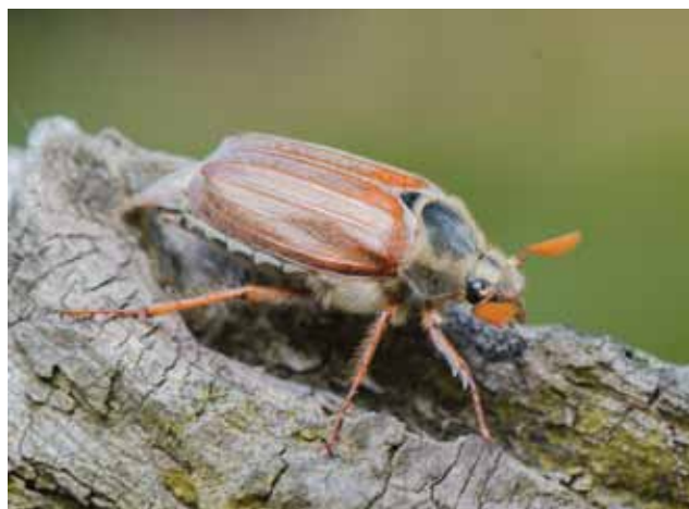
Mannelijke Meikever met duidelijke "bladsprietten".

Een 'Aprilkever' bestaat niet, maar de Junikever daarentegen wel (aan de kust komt zelfs een soort voor die 'Julikever' noemt). Alle zijn ze verwant, want ze behoren tot de familie van de Bladsprietkevers. Die naam danken ze aan het feit dat hun 'sprietten' of antennes vooraan de kop, eindigen in een lamellen-vormige vergroeiing. De Junikever kan je -vooral in juni- op zwoele avonden aantreffen, vliëgend rond jonge boompjes. Daar ontmoeten de paartjes mekaar. De soort is niet klein (20mm lang), maar toch aanzienlijk kleiner dan de Meikever (30mm). Zowel de Mei- als de Junikever eet als volwassen insect bladeren. Als ze soms met velen zijn, worden ze daarom door de mens wel eens als 'schadelijk' bestempeld. Nochtans leven de kevers maar een maand. De larven leven twee jaar onder de grond en eten daar vooral wortels van grassen.