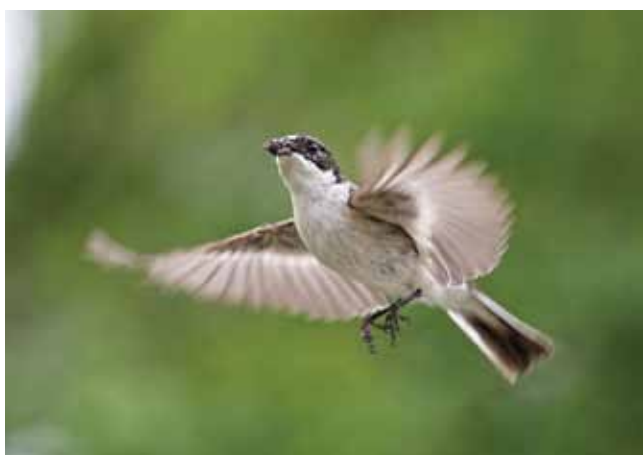
Bonte vliegenvanger

Daarnaast blijkt uit systematische tellingen dat een groot deel van onze trekvogels hun aankomstdata hebben vervroegd in vergelijking met vroeger. Soms zelfs met enkele weken.