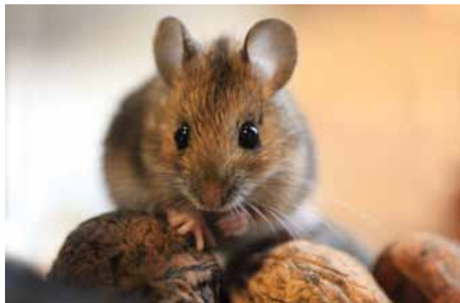
Bosmuis op okkernoten.

Soms legt de Bosmuis een voedselvoorraad aan in de omgeving van haar hol. Dit zijn kleine, cilindervormige