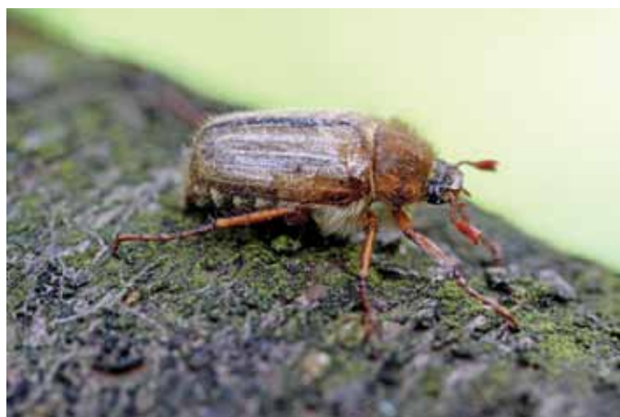
De Junikever vind je vaak vliëgend rond jonge boompjes

De Meikever is ongetwijfeld één van de bekendste keversoorten hier bij ons. Tot de jaren 1950-1960 werd deze kever op vele plaatsen massaal aangetroffen en sprak men zelfs van 'plagen'. Jonge kinderen speelden met de kevers, die met een koordje aan de poot al vliëgend werden 'uitgelaten'. In mijn jeugd (jaren 1970-1980) was de kever op vele plaatsen erg zeldzaam geworden. Dat was min of meer ook nog het geval in de jaren 1990. Het verminderde gebruik van biociden zorgt er nu al een aantal jaren voor dat de Meikever terug aan een opmars bezig is. De larve ('engerling' genoemd) van deze tor leeft namelijk van plantenwortels en heeft dus erg te lijden onder allerlei 'sproeieregimes' met vergif. In 2013 kropen