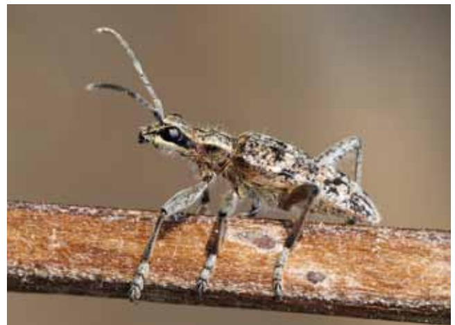
De Grijze ribbelboktor, onverwacht in de stad

Een andere 'onverwachte gast' was de Grijze ribbelboktor. Deze behoort tot de familie van de Boktorren, die haar naam dankt aan de vaak lange slanke, en naar achteren gebogen antennes van de volwassen kevers. Toevallig vormt de Grijze ribbelboktor daar een uitzondering op. Zijn antennes zijn dus niet opvallend lang. De larven van deze kevers leven in hout van verschillende boomsoorten. De kevers zijn niet schadelijk omdat ze alleen in dood hout leven. De volgroeide kever komt vanaf de lente te voorschijn en produceert via het over mekaar wrijven van speciale ribbeltjes, een sjirpend geluid wanneer hij zich bedreigd voelt •