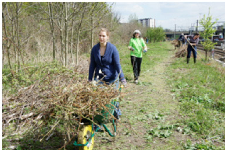
Beheerswerkzaamheden op Wolvenberg

Zo vraagt het bestrijden van exoten bijvoorbeeld veel werk van onze beheersploeg. Ook het verwijderen van sluikstort en het herstellen van vandalisme-daden vragen tijd en inspanning, ook al worden we hierin bijgestaan door de diensten van de stad. Verder wordt op een aantal plaatsen een beheer toegepast ten voordele van ruigtes en grasland. Dat zorgt weer voor een rijkere biodiversiteit. Ook de vijver vergt occasionele beheersingrepen.