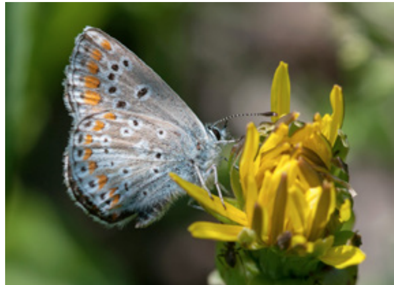
Bruin blauwtje, een soort van zandgronden

Bruin blauwtje werd hier recent gespot. Deze soort vind je normaal terug in duinen en opgespoten zandterreinen. Deze vlinder is zeker geen gewone gast. Vooral als je weet dat het een kwetsbare soort is én een troetelsoort van het project 'de Antwerpse haven natuurlijker', waar naar een evenwicht wordt gezocht tussen de ontwikkeling van de haven en van de natuur.