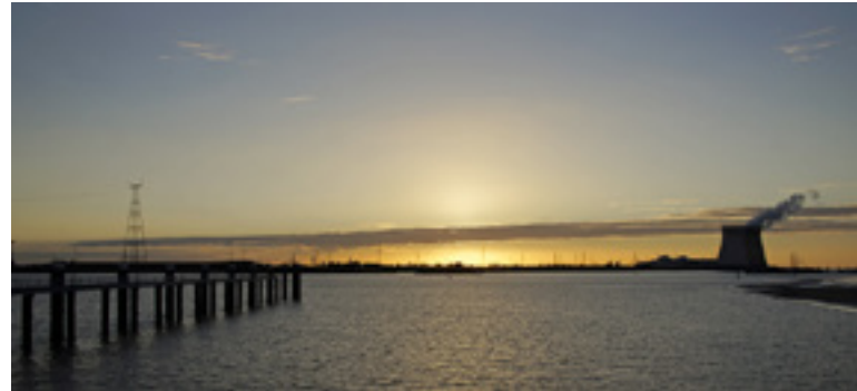
Antwerps havengebied