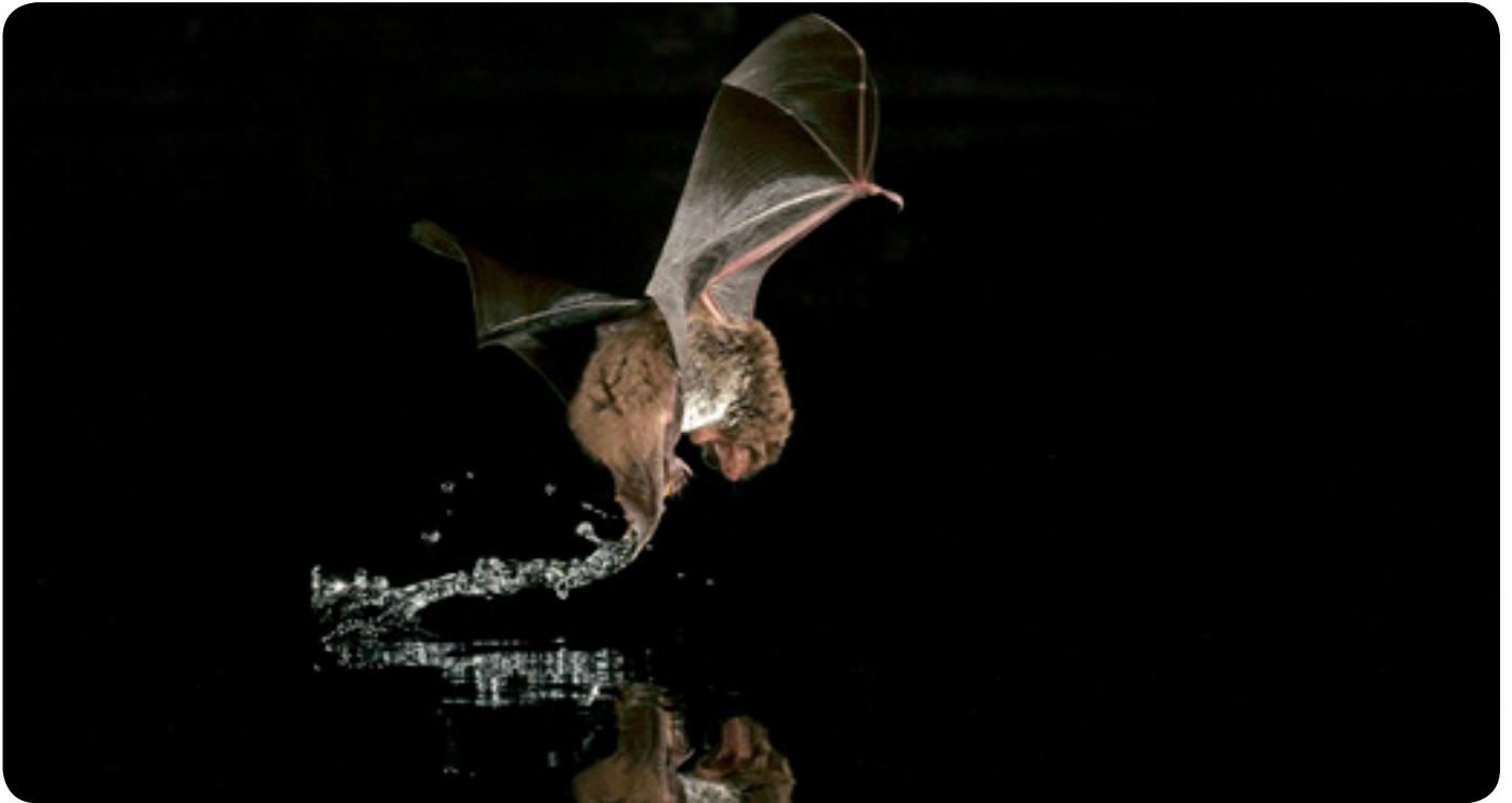
Waternat, op verschillende plaatsen in Antwerpen aangetroffen

Bijna overal in de stad kunnen we vleermuizen tegenkomen. Ik deed een testje. Vorige zomer trok ik bij mijn dagelijkse avondwandeling met de hond telkens naar plekje in de stad waar meerdere bomen bijeen staan. Op zoek naar vleermuizen.