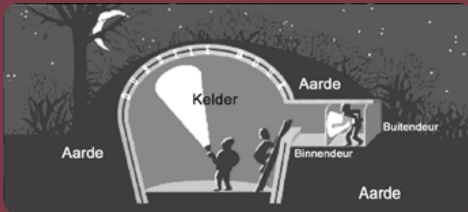
Doorsnede van een ijskelder

De terreinploeg van Natuurpunt zal de werken uitvoeren en we hopen om alles klaar te hebben tegen de Nacht van de Vleermuis op 24 augustus van dit jaar.