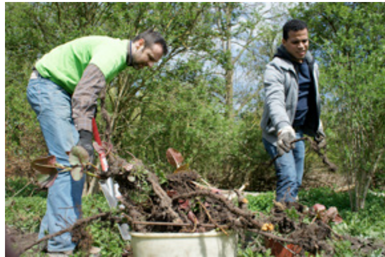
Beheerswerk in de Wolvenberg