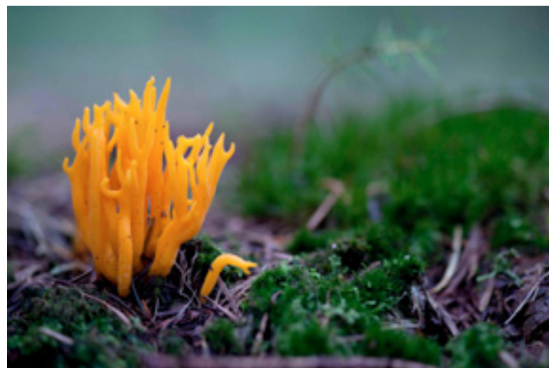
Kleurig koraalzwammetje