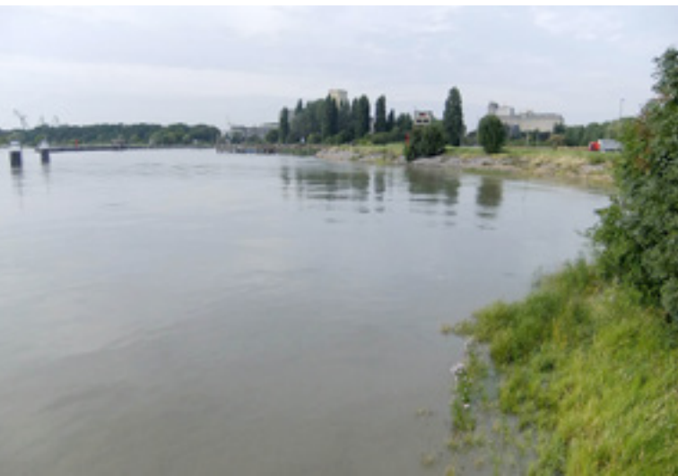
Aan de bocht van Oosterweel, bij hoog water