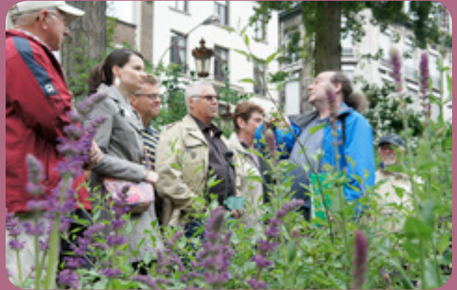
Tijdens de bijenwandeling van vorig jaar