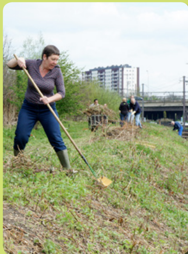
Beheerswerken langs spoorwegberm