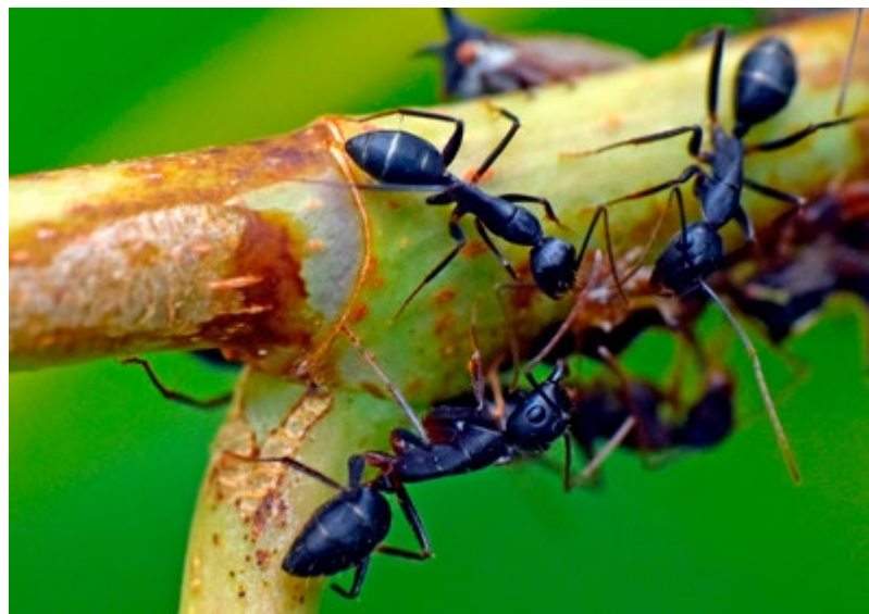
Mieren produceren hun eigen antibiotica

De klimaatverandering. Vorige zomer was het erg warm en zijn veel brandnetels verdroogd. En dat is nu juist de plant die zo belangrijk is voor de rups van de Dagpauwoog (vlinder).