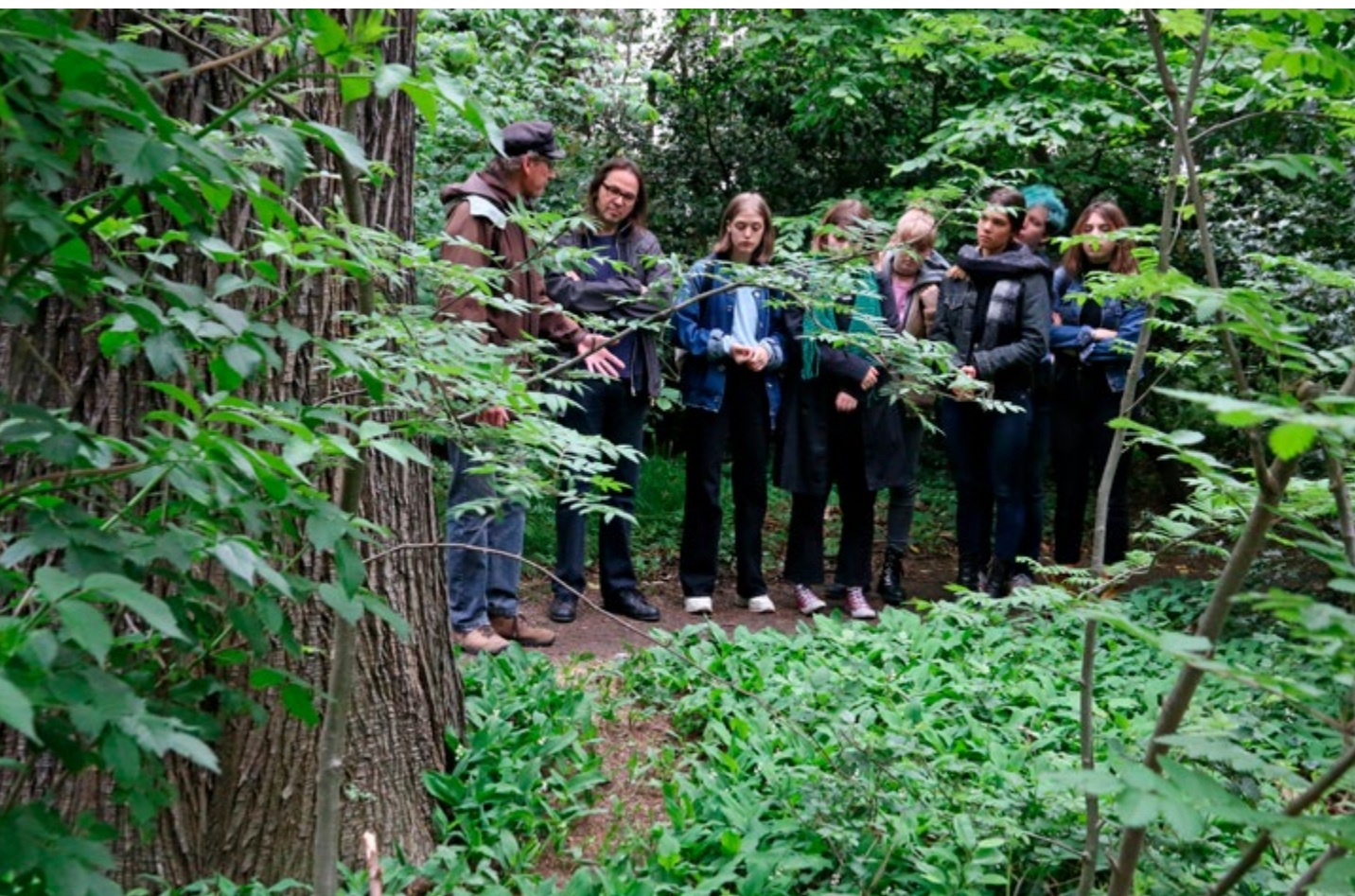
Monitoring in Domein Hertoghe