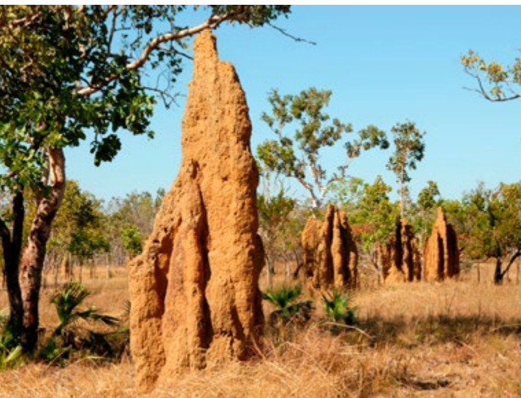
Termietenheuvels, een voorbeeld van airco