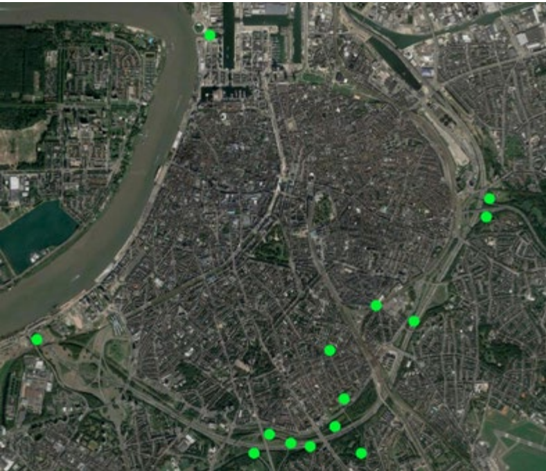
Vossenwaarnemingen volgens Waarnemingen.be en Dieren onder de Wielen tussen 5 januari 2016 en 30 juni 2019 (grafiek: Koen Van Keer)

Drie jaar geleden brachten we al eens een overzichtje van de vossenwaarnemingen in Antwerpen Stad. Nu bekijken we waar in onze afdeling de soort sindsdien nog gezien is en of er een verschil merkbaar is.