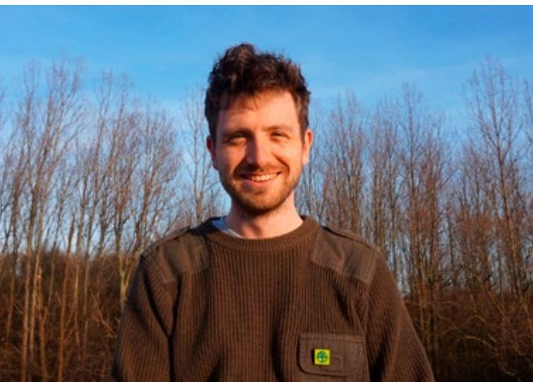
Mittch Maree

Heb jij ook zo'n talent? En heb je goesting om Natuurpunt Antwerpen Stad te helpen? Stuur dan een mailtje naar: info@natuurpuntantwerpenstad.be en vertel ons wat meer over jou! ■